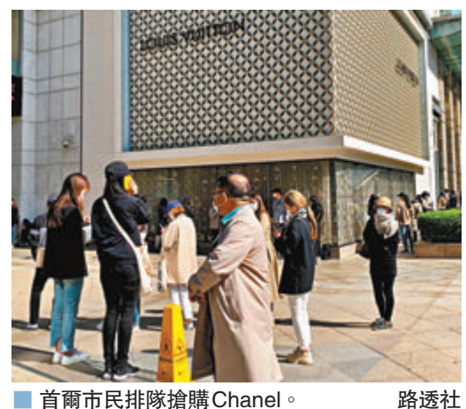
■ 首爾市民排隊搶購Chanel。

韓國流行以名牌手袋作結婚禮物，自從本月初當地放寬防疫措施以來，百貨公司人流已連日回升。樂天百貨透露，本月首10日營業額較上月最後10日增長約3成，大部分增長來自奢侈品。