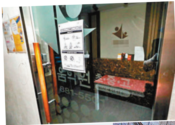
▲ 確診補習教師授課的補習社。網上圖片

韓國軍方一名軍官到梨泰院夜蒲後中招，國防部表示已對曾與這名軍官密切接觸的官兵進行檢疫，昨日再多3名隸屬網絡行動指揮部的士兵確診，累計軍方11人受感染。由於77名新招募的軍人表示曾到梨泰院消遣，軍方預計將出現更多確診病例。