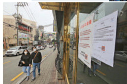
▲ 群組感染事件發生後首爾關閉夜店。