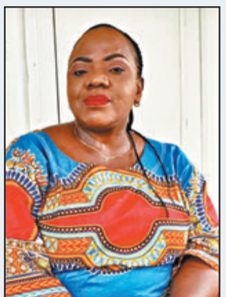
■ 穆金加 美聯社