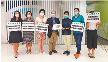
■「婦女權益聯盟」到平機會投訴「全民記者」性騷擾女警。

香港文匯報訊（記者 子京）旺角山東街周日發生黑暴堵路及縱火，兩名女警執勤期間被網媒「全民記者」的男記者在直播中以近鏡對準上半身拍攝，及以粗言穢語對其身材評頭品足，涉嫌性騷擾。多個婦女團體對此事件極為不滿，昨日中午先後到平等機會委員會投訴。民建聯立法會議員葛珮帆昨日亦去信平機會，要求平機會嚴肅處理事件並展開調查，對肇事者作出譴責及採取相應行動。