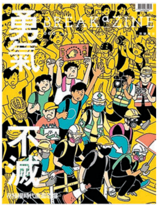
有市民指控突破機構旗下《Breakazine 060》刊物鼓吹黑暴，單向描繪「勇武」為「受害者」，不斷美化同情暴行。市民昨日發起聯署，呼籲突破能早日重回正軌。

策而沒有建設性的提議呢？」 聯署最後寫道，青年人繼續以暴力「抗爭」的趨勢不減反升，令家長、教育工作者、社工、關注年輕人生命的人均表憂心，呼籲突破「能切實以主耶穌基督的愛和標準，引領青少年重回正軌」。