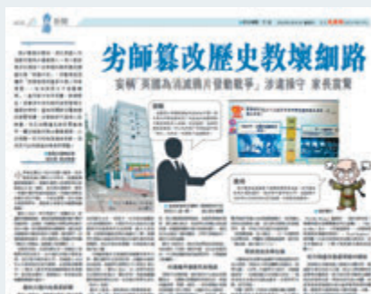
香港文匯報前報報道可立小學常識科「黃師」歪曲鴉片戰爭歷史事件。

香港文匯報訊（記者 高鈺）針對香港可立小學常識科「黃師」早前於網上教學歪曲鴉片戰爭歷史，將英國的侵略扭曲成「為消滅鴉片才發動戰爭」。可立小學日前發通告指，為釋除家長疑慮及擔心，校方於4月29日開始已暫停涉事老師的教學職務，並由副科主任接手小二常識科，確保學生學習進度不受影響。