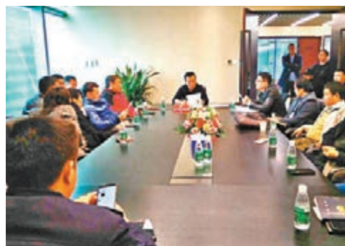
理想寶投資者與公司高管商討兌付問題。香港文匯報深圳傳真

香港文匯報訊（記者 李昌鴻 深圳報道）網貸市場近日再掀波瀾，深圳最大的網貸平台（P2P）小牛在線日前宣佈良性退出網貸行業，將兌付104.2億元（人民幣，下同）的投資人借款，並承諾退出期間平台股東及高管不跑路、不失聯、不撤資。不過，投資者在深圳另一家網貸平台理想寶卻遇到不同待遇，有投資者指，其投資款被打6折，並且大部分未有兌付。理想寶客服人員表示，公司高管外出籌錢，具體情況他並不知情。有理想寶投資者向香港文匯報投訴，稱