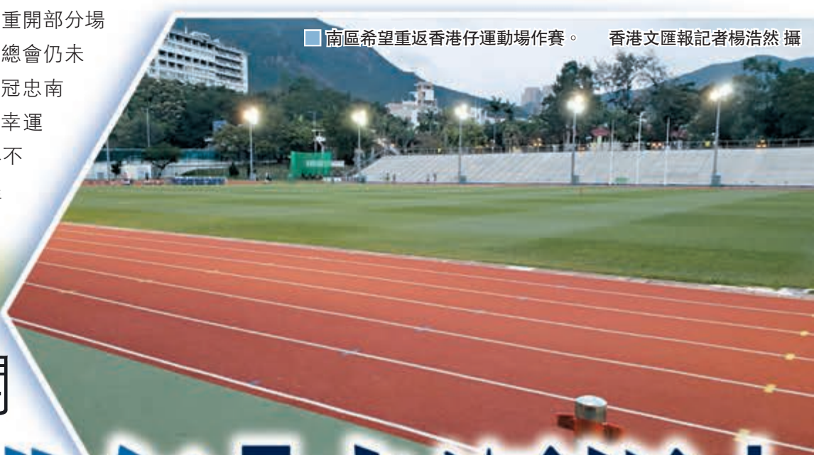
南區希望重返香港仔運動場作賽。

本港新冠肺炎疫情逐漸受控，康樂及文化事務署過去周日（本月10日）宣佈重開部分場地設施，體育活動可望逐漸恢復正常。惟因足球場地暫時仍然封閉，香港足球總會仍未能落實港超下半季賽程。暫時可肯定的，就是聯賽榜修訂後排名升上次席的冠忠南區，將重返有「地獄主場」之稱的香港仔運動場作賽，而這也是冠忠的「幸運場」；至於「一哥」富力R&F，則極可能被迫放棄內地主場之利，在港九新界不同場地「打游擊」作賽。換言之，今次疫情對榜首雙雄爭標前途，都有一定程度影響。 ■香港文匯報記者 黎永淦