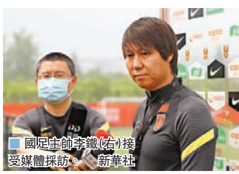
國足主帥李鐵(右)接受媒體採訪。

「因為疫情的影響，很多賽事都中斷了，隊員們很長一段時間沒有比賽，球員狀態一般也能夠理解。但是集訓開始之後，我還是會要求隊員們每一天的訓練都必須竭盡全力。」昨日，男足國家隊在上海公開訓練前，主帥李鐵對記者如是說。