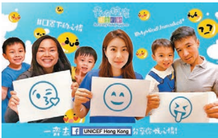
郭晶晶(左四)、李慧詩(左二)和黃金寶(右)均有參與活動。

嘅等待都係操練自己嘅機會。保持一顆平常心，每一個細節都力臻完美，之後回望經歷過嘅挫折與努力，相信每個人都會感激啱家嘅自己。即使出街仲未除得口罩，都要執靚心情，珍惜每一刻。」 余翠怡則表示：「嘅艱難嘅時刻，最緊要係調節心態。雖然奧運延期打亂晒訓練計劃，但留喺屋企都會記得train from home，為未來作好準備。『關關難過關關過』，輸咗嘅比賽可以一劍一劍贏翻嚟，無論有咩風雨，我哋一樣可以笑住面對。」