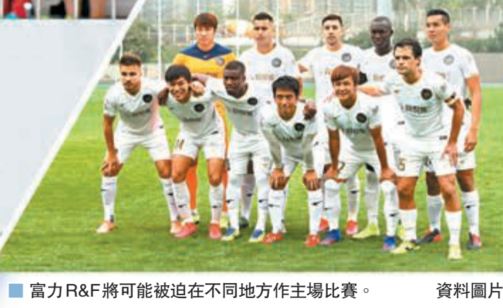
富力R&F將可能被迫在不同地方作主場比賽。