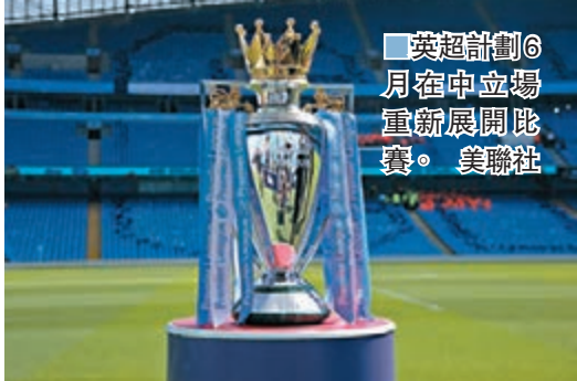
英超計劃6月中立場重新展開比賽。

香港文匯報訊(記者 梁志達) 隨着德甲已決定本月重開, 英超也積極爭取恢復比賽。英國政府昨日公佈了體育賽事重啟日程, 批准6月1日起可在