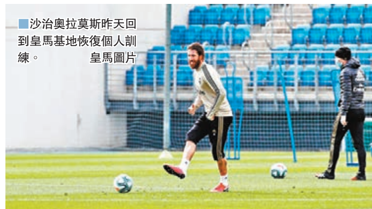
沙治奧拉莫斯昨天回到皇馬基地恢復個人訓練。皇馬圖片