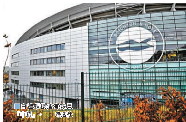
白禮頓接連有球員「中招」。