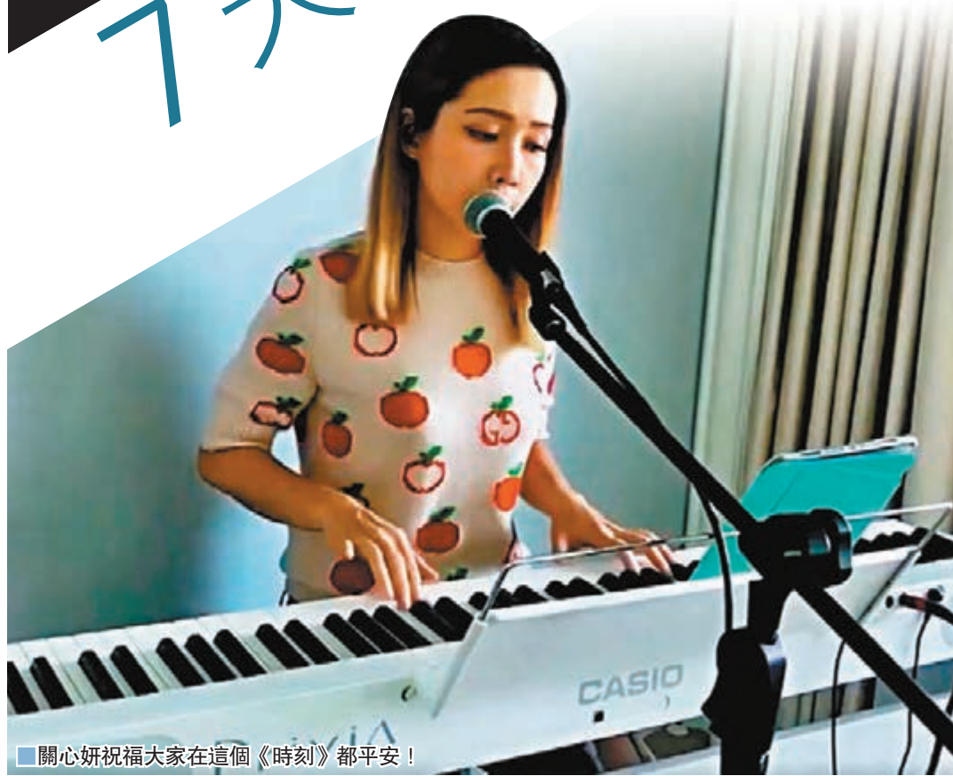
關心妍祝福大家在這個《時刻》都平安！