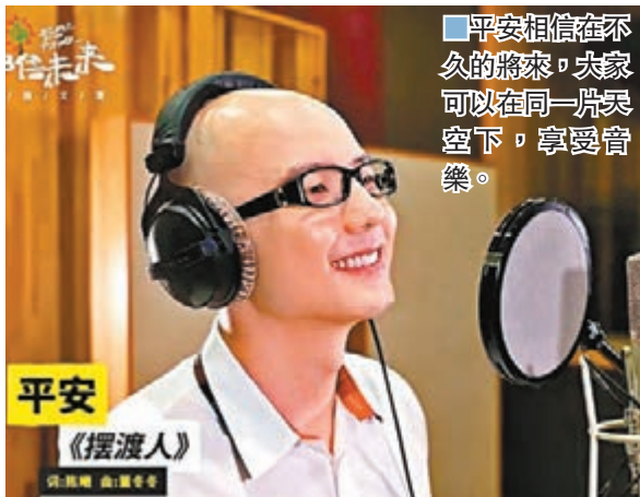
平安 《擺渡人》 詞曲：Kings 平安相信在不 久的將來，大家 可以在同一個空 下，享受音樂。