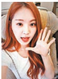
Apink 成員 孫娜恩。