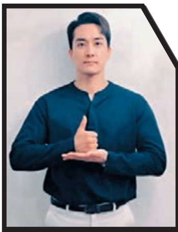
宋承憲 樂於接受挑 戰。網上圖片