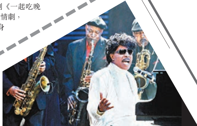
Little Richard 有「美國搖滾之 父」美譽。

另外，宋承憲將出演MBC新電視劇《一起吃晚餐嗎》，該劇是一部趣味濃厚的浪漫愛情劇，講述的是一對因分手帶來的傷痛和獨身文化而失去愛情的男女在一起吃晚餐時還互相曖昧。由宋承憲、徐智慧、李智勛、孫娜恩等紅星一起演出。