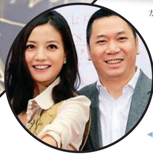
趙薇夫婦近年來是非不斷。

據悉，趙薇夫婦上月主動聯絡業主，並最終以 2,765 萬新加坡元（約港幣 1 億 5,178 萬元）的高價買下這套房產的永久地契，比原價多付近半億。另外值得一提的是，黃有龍是以新加坡公民的身份，並以受託人的方式成功購置這間豪宅，但受益人很有可能是他的女兒黃新（小四月），據了解，趙薇與黃有龍的女兒黃新 2010 年出生於新加坡，趙薇夫婦亦同時持有新加坡永久居民身份證。新加坡媒體同時也指出，此豪宅並不是趙薇夫婦在新加坡的唯一一處房產，他們至少還擁有另一套房產，只不過位置具體是否在另一街區低層的四房戶。趙薇通過《還珠格格》、《情深深雨濛濛》等作品受到大眾喜愛。近年來，趙薇和黃有龍頻頻被傳離婚，夫妻倆雙親自否認，黃有龍聲稱會採取法律手段維護自己的權益，而趙薇曾在微博上發文：「我不需要向任何人說什麼，或者解釋什麼。」不過，近來黃有龍被財務官司纏身則是不爭的事實。