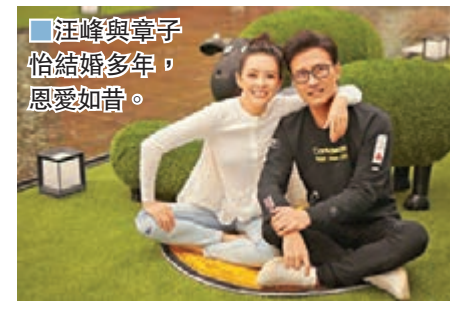
汪峰與章子怡結婚多年，恩愛如昔。

汪峰亦特別提到：「奶奶剛剛走了，走之前她說：有你在身邊，這一世再無遺憾與牽掛，熙熙快長成一個大姑娘了，從此她也要和我們相依為命。她是幸運的，有你這樣優秀的媽媽在身邊陪伴，是她的福分。願我平安健康，多年後當我老去的時候還能夠陪著你寵著你；願我們的愛永遠清澈而深沉，有一天兒女們長大成人，闖蕩世界不再相伴我們的時分，我倆依然相愛如少年。」他續稱：「最成功的人生不是鮮花與掌聲，財富與榮耀，而是當人生的清冷孤寂襲來時，有一個人能夠像寒夜裡的篝火那樣可以取暖與依偎；當生命將要走到盡頭，可以不因為追悔而枯萎，依舊如孩子般的真摯，無視死亡。願我們能如此攜手相伴，直到永遠！辛苦了，醒醒媽媽。母親節快樂！結婚紀念日快樂！」