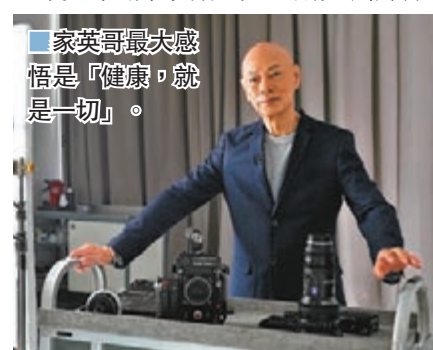
家英哥最大感悟是「健康，就是一切」。

在台上做慣瀟灑架勢的家英哥坦言：「2004 年確診肝癌時不知所措，英雄都驚，何況我只是普通人，當時感到絕望，以為無可能再做（粵劇）」他亦在訪問中細訴與阿姐的一段情：「阿姐在雲端，我在平地，最終能夠一起，是個奇蹟」。當被追問為何當初二人會走在一起時，家英哥不忘搞笑：「我哋都空虛、寂寞吧！」他又透露，當年為追悼亡母撰寫訃聞，令家英哥萌生結婚念頭，雖然鼓起勇氣向阿姐求婚，但卻被對方狠拒。在一輪愛情长跑後，家英哥本來再無結婚念頭，此時竟反過來被阿姐開口求婚，提議前往拉斯維加斯結婚，最終結束長達 20 年的愛情长跑。走過人生高高低低，家英哥最大感悟是「健康，就是一切」，「我想做好電影、教好粵劇，沒有好的身體，又怎樣去做呢？我很聽醫生話，該做的檢查必定做，該用的藥一定用」，加上阿姐不時煲湯水滋潤，細心照顧起居飲食，給了他強大的支撐。