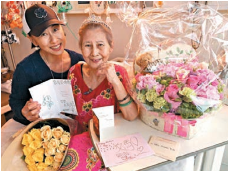
沙麗每天都風雨不改送飯給母親。

香港文匯報訊（記者 阿祖）今年在疫情下的母親節，雖然剛剛放寬了「限聚令」，不少家庭都可外出吃餐飯為偉大的母親慶祝，但仍有不少人選擇留在家中慶祝，而圈中多位藝人，則選擇在社交平台歌頌偉大的母親，葉蒨文（沙麗）帶着花束到醫院送給媽咪，又為她戴上后冠，楊采妮則貼上兒時與母親的合照讚頌母親的偉大，劉嘉玲都有送花給媽咪，袁詠儀則收到兒子張慕童（Morton）送的心意卡，最是窩心。葉蒨文的 80 多歲母親因慢性肺炎長期住院，沙麗其實每天都風雨不改送飯給母親，為她拍痰。她說過爸爸離世後，便安排媽媽來港定居以方便照顧，但由於媽媽患有慢性肺炎，一半的肺葉已經失去功能，經常要出入醫院：「我是獨生女，很有福氣可以照顧我的媽媽，媽媽現在只有 38 公斤，很瘦，很瘦，但她很精神，講話聲音比我還要大。」而趁着母親節，她就買了兩大束玫瑰花到病房送給媽媽，心意卡上寫着「親愛的媽媽」，下款是「你的大沙麗」，她還為媽媽戴上后冠，哄得媽媽樂透了！沙麗貼上與媽媽的溫馨合照，並撰文：「HI！所有的媽咪們，祝這個美麗的世界所有的媽咪們都有一個暖暖的、充滿擁抱的、快樂的、豐盈的、溫柔的、讓心融化的、瘋狂的、溫馨貼心的、充滿祝福的母親節！」沙麗續稱：「希望在這天大家都和自己深愛的母親一起做特別的事！給大家和你們敬愛的媽咪們送上祝福，愛、和平以及光明！」