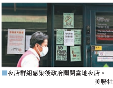
■夜店群組感染後政府關閉當地夜店。