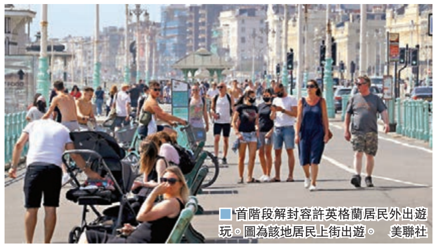
■首階段解封容許英格蘭居民外出遊玩。圖為該地居民上街出遊。

英國首相約翰遜前日公佈「解封路線圖」，計劃在首階段，允許英格蘭地區居民進行戶外活動，並陸續復工。不過新指引出爐後遭狠批，《衛報》更稱措施分化英國不同地區，而且製造混亂。蘇格蘭、威爾斯和北愛爾蘭地方政府均表示，會繼續沿用「留在家中」指示，而非跟隨約翰遜改為「保持警惕」。