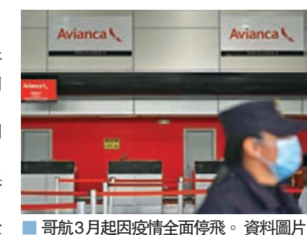
■哥航3月起因疫情全面停飛。 資料圖片