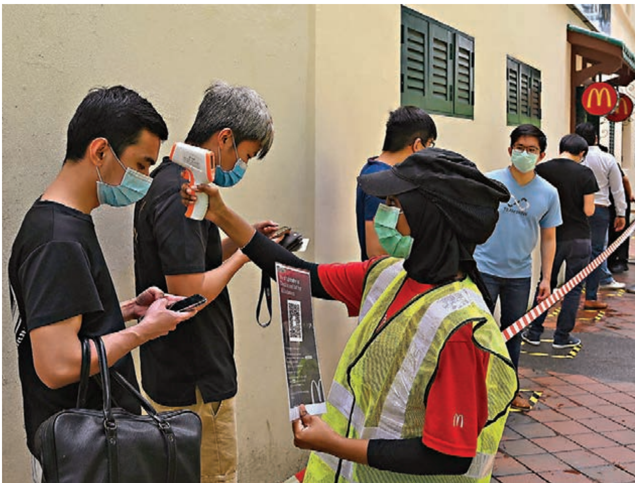
■新加坡前日傳出檢測失誤事件，33人被誤列為確診病例。圖為市民在進入麥當勞餐廳前接受額溫測試。