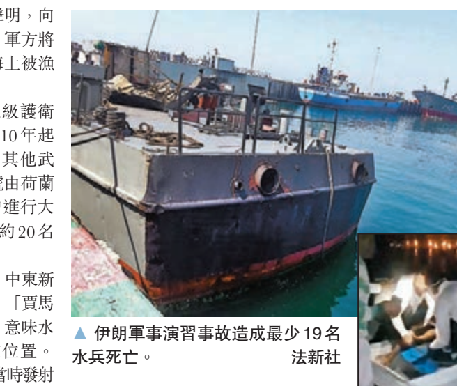
▲伊朗軍事演習事故造成最少19名水兵死亡。

暫時未知事件有否涉及人為失誤。中東新聞網站AMN等外媒引述分析報道，「賈馬蘭」號配備的導彈以雷達自動導航，意味水兵不會監測導彈，亦不知道其所在位置。《每日郵報》則報道，「賈馬蘭」號當時發射的是伊朗製「努爾」反艦導彈。