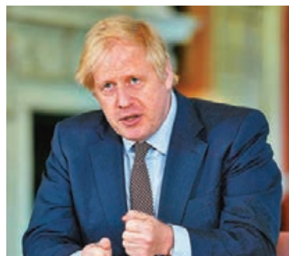
■約翰遜前日公佈「解封路線圖」。

英國新冠肺炎死亡病例超過3.1萬宗，屬全歐最高。約翰遜稱英國將於短期內，對從機場入境的人士實施14天隔離檢疫，約翰遜與法國總統馬克龍前日通電話後，雙方達成共識，不會對從法國抵達英國的旅客採取隔離檢疫措施，日後亦只會在雙方同意下才會實行。