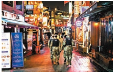
■多名軍官夜蒲後感染新冠病毒。