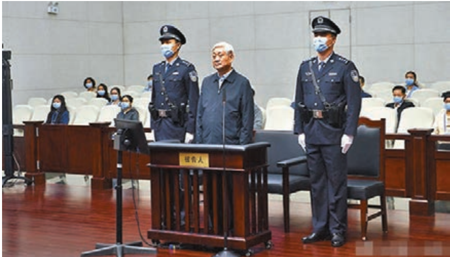
11日，天津市第一中級人民法院一審公開開庭審理了陝西省委原書記趙正永受賄一案。趙正永當庭表示認罪悔罪。網上圖片

庭審中，檢察機關出示了相關證據，被告人趙正永及其辯護人進行了質證，控辯雙方在法庭的主持下充分發表了意見，趙正永進行了最後陳述並當庭表示認罪悔罪。庭審最後，法庭宣佈休庭，擇期宣判。