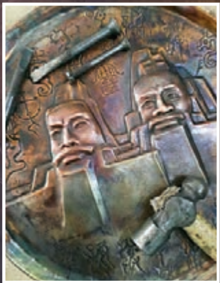
炎黃二帝銅浮雕。