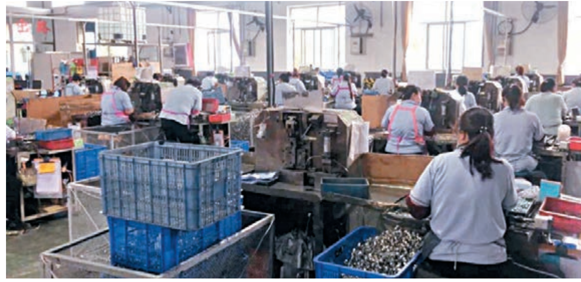
天津凱諾實業有限公司銷售額逆市增長。

香港文匯報訊（記者 任芳頌、張聰 天津報道）新冠肺炎疫情衝擊着全球經濟，世界各大小企業均遭受不同程度的影響。同大多數企業一樣，天津凱諾實業有限公司在疫情發生後也歷經了訂單取消、付款延遲等一連串遭遇，一季度銷售額同比下滑40%，而他們四月份的銷售額卻比去年提升6.2%，甚至預計2020年全年可實現6%的增長。銷售額能實現逆風翻盤，最重要的是企業堅持「專精特新」的發展道路，使旗下卡箍成功打破國外壟斷。