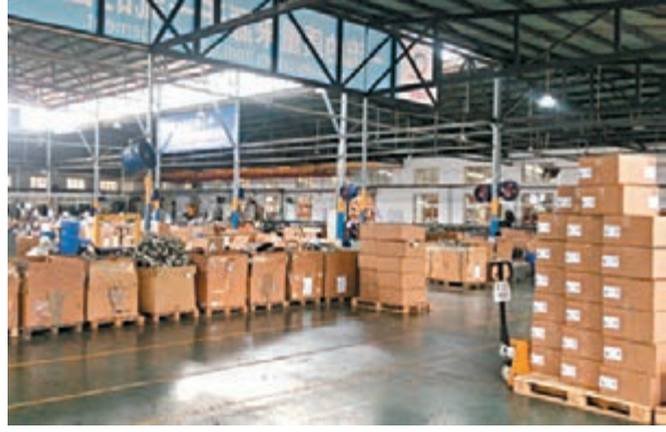
海外疫情嚴重，所有海外訂單貨品只能全部放置庫房。