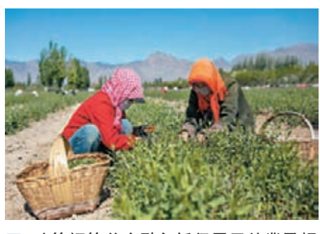
政策調節着力點包括保居民就業及糧食安全。圖為寧夏某茶園。

李克強感謝各民主黨派、全國工商聯、無黨派人士長期以來對政府工作的關心支持，希望繼續同舟共濟、共克時艱。他說，受疫情嚴重衝擊和世界經濟衰退影響，中國發展面臨前所未有的困難挑戰。要堅持以習近平新時代中國特色社會主義思想為指導，及時跟蹤分析形勢變化，加大宏觀調控力度。政策調節着力點要放在六穩、六保上，突出保居民就業、保基本