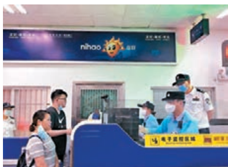
合資格的內地輸澳勞務人員11日起往返珠澳通關後可豁免隔離醫學觀察。

另外,香港特區政府早前宣佈,符合香港經濟發展利益的商務人士,可獲豁免檢疫隔離14天。會計界昨日召開記者會,希望在適當的防疫保護措施下,特區政府豁免會計