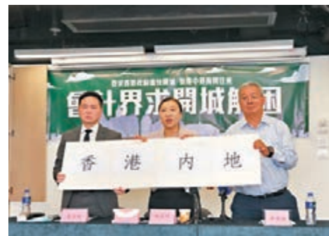
香港會計界希望在適當的防疫保護措施下,特區政府能豁免會計師來回香港與內地的14天隔離期。

師來回香港與內地的14天隔離期。滙港專業人士聯會會長趙麗娟表示,政府首期只考慮開放部分會計事務所的會計師前往內地無需隔離,但該類受惠會計師不到業界的5%。