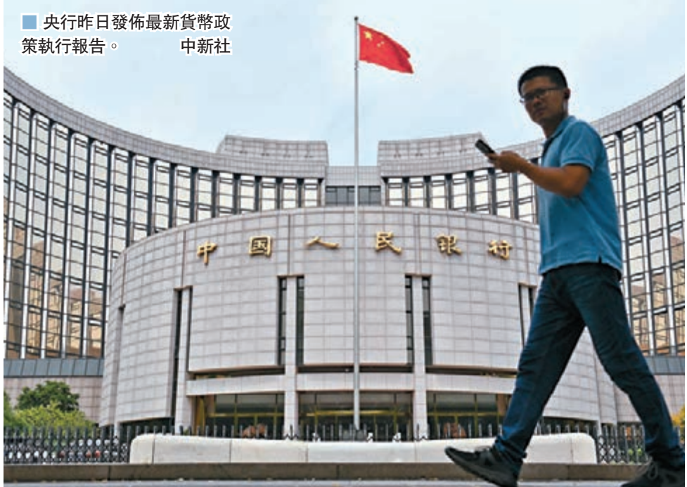
央行昨日發佈最新貨幣政策執行報告。