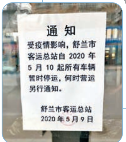
舒蘭市10日起「封城」。網上圖片