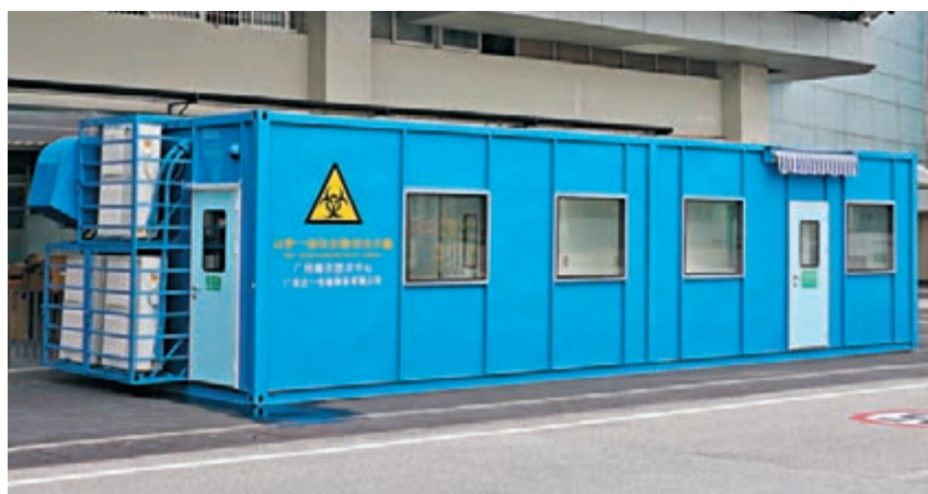
全國首創移動式一體化生物安全方艙在廣州白雲機場落地。

5月6日，首個移動式一體化生物安全方艙運抵廣州白雲國際機場，在T1航站樓112號廊橋附近安裝完成。5月7日12時，生物安全方艙正式啟用。方艙為箱式結構，藍色塗裝，長12米、寬3.5米、高3米，內部設計緊密貼合口岸衛生檢疫工作流程，設置梯度負壓，整體達到生物安全二級（P2）以上防護標準，可實現保護工作人員、保護旅客及保護環境的「三保護」功能。海關關員在方艙裡按區域開展流