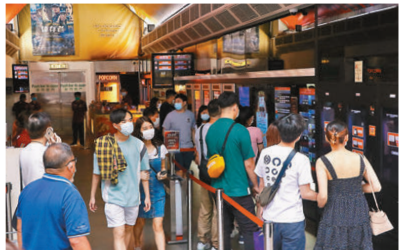
戲院人頭湧湧。