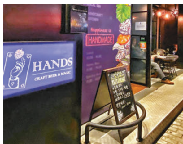
Hands酒吧的單據顯示事發時仍有多人曾落單要求食物和飲品。