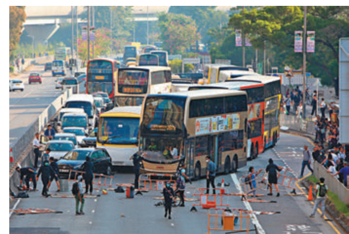
11月11日，有激進示威者在各區用雜物堵路、縱火，造成交通嚴重堵塞，市民出行困難。