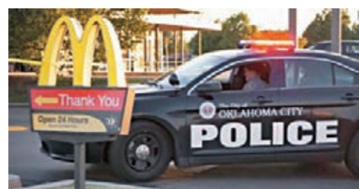
美國兩名女子光顧麥當勞時，被告知不准堂食後，用手槍向兩名男店員開槍。

美國各地近期發生多宗因不滿防疫措施引發的暴力事件，在密歇根州一間雜貨店，一名保安員按規定要求一名顧客戴上口罩，竟被對方開槍射殺。