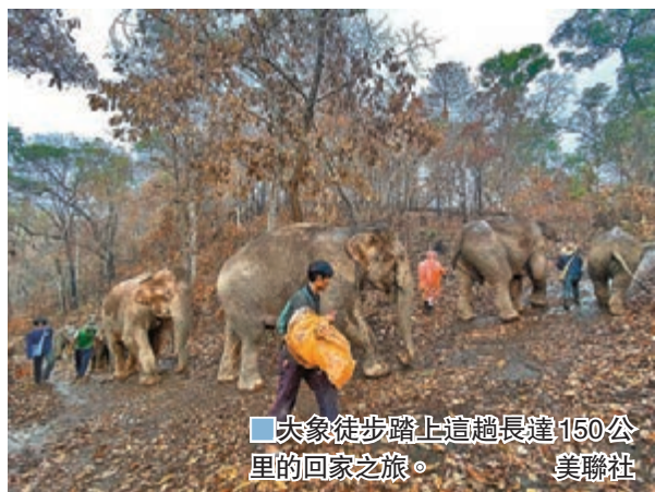
大象徒步踏上這趟長達150公里的回家之旅。