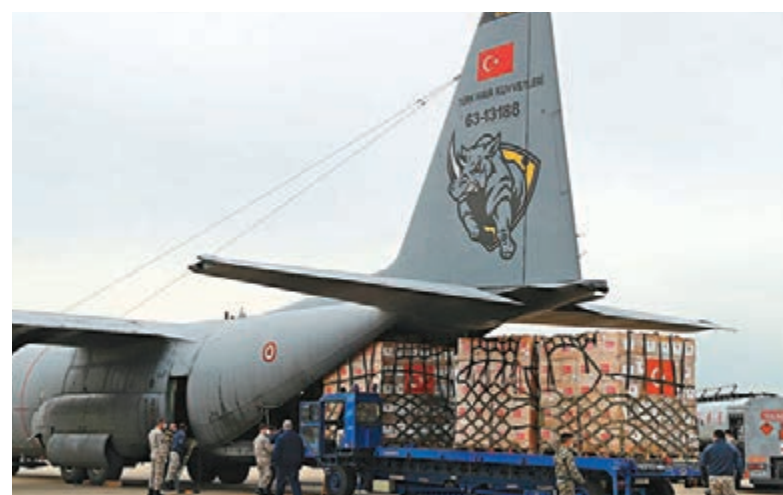
英國向土耳其購40萬件防護衣，不但交付延遲，甚至全部不符合英方標準。

英國醫護人員上月投訴防護裝備嚴重不足，房屋、社區及地方政府大臣鄭偉祺當時大派「定心丸」，聲稱將有大批防護裝備從土耳其運抵。