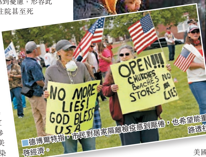
德博爾特指，市民對居家隔離檢疫感到厭倦，也希望重新啟經濟。