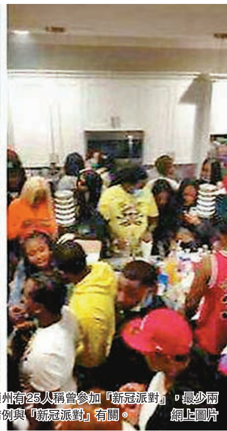
華盛頓州有25人稱曾參加「新冠派對」，最少兩宗新增病例與「新冠派對」有關。