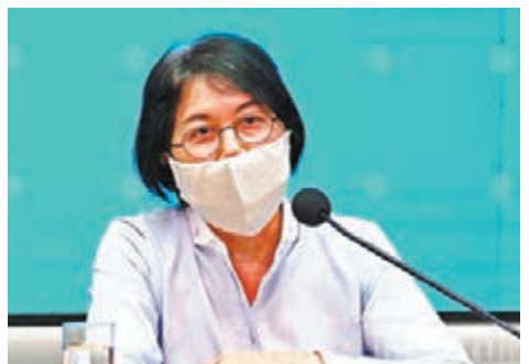
創新及科技局長常任秘書長蔡淑嫻說,「銅芯抗疫」口罩每個整體成本大約30元至40元。

香港文匯報訊(記者文森)香港特區政府向全民派發可重用口罩,香港郵政局員工會主席卓信昨日在電台節目上表示,