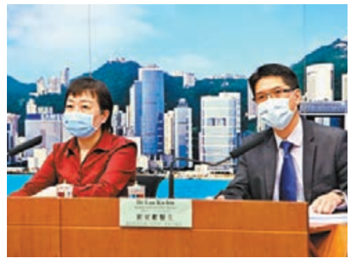
劉家獻(右)表示,有信心出院後「復陽」的病人均不具傳染性。旁為張竹君。

衛生防護中心轄下的科學委員會日前更新出院準則,病人滿足原有條件或是驗出抗體,都可以出院。劉家獻表示,醫管局已開會討論新準則,會盡快應用,但安排需時,會視乎每位病人的實際情況。