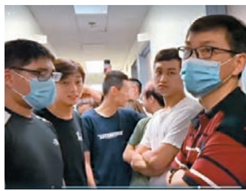
學生趁機發難與舍監及保安人員發生爭執，更有人粗言辱罵舍監。 視頻截圖

警方在回應傳媒查詢時則表示，警方在凌晨2時多收到城大學生宿舍職員報警，投訴噪音及報稱有人吸食危險藥物，警員接報後到場調查，並無發現吸食工具和危險藥物，暫以一般糾紛案處理，未有人被捕。