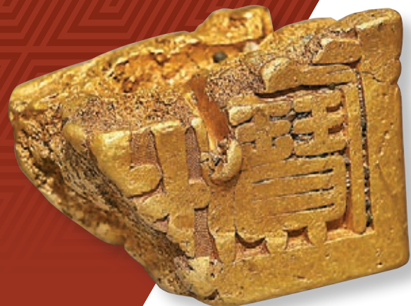
■江口沉銀遺址出土「蜀世子寶」金印