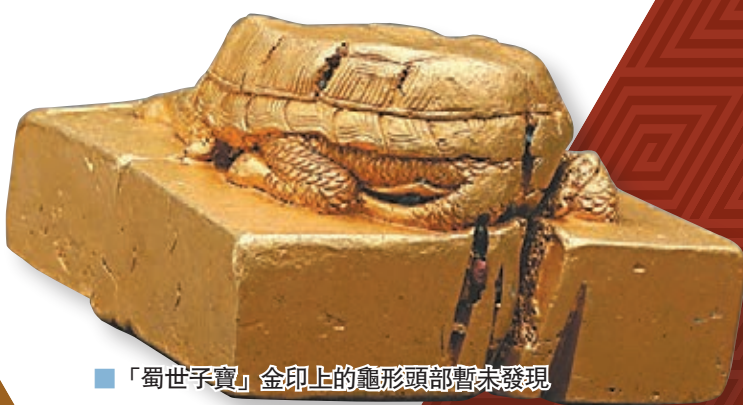
■「蜀世子寶」金印上的龜形頭部暫未發現

「石龍對石虎，金銀萬萬五，誰人識得破，買到成都府。」在四川，這首關於張獻忠沉銀的童謠曾廣為流傳。香港文匯報記者日前從四川彭山江口明末戰場遺址（江口沉銀）第三期考古發掘成果通報會上獲悉，從2017年1月5日正式啓動水下考古發掘以來，三期考古發掘共出水文物5.2萬件，不僅揭開了明末農民起義首領張獻忠與明朝參將楊展開戰和沉銀的面紗，也使明末清初那段涵蓋經濟、政治、文化、社會、軍事環境等內容的歷史得以鮮活地呈現眼前。 文、攝：香港文匯報記者 向芸