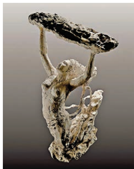
■著名雕塑家、畫家袁熙坤雕塑作品《女媧補天》