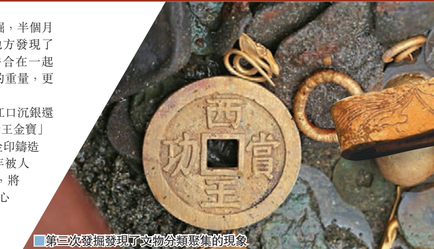
■第三次發掘發現了文物分類聚集的現象