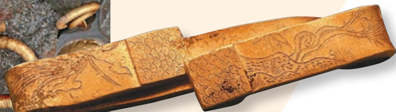
■第三次考古發掘了大量金飾品