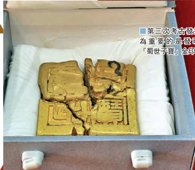
■第三次考古發掘最為重要的是發現了「蜀世子寶」金印

而二期考古出水的「蜀王金寶」，則是蜀王所有。明朝藩王金寶也被叫做金印章。根據明史記載，冊封親王時往往會用到金冊或金寶。不過每一代藩王都會有自己的金冊，而每個王府擁有的金寶則只有唯一一枚，作為明代親王在藩地發佈政令、與中央書信往來的信鑒，每個藩王府唯一的一枚金寶，在分封時就代代傳襲。