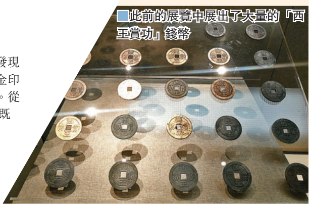
■此前的展覽中展出了大量的「西王賞功」錢幣