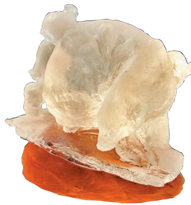
■著名雕塑家、畫家袁熙坤雕塑作品《極地之熊》

補天》雕塑被聯合國選為「補天行動」項目的象徵，並於2012年11月21日安放在維也納聯合國總部。近年來，該雕塑頻頻亮相各大國際環保會議、活動，屢被國際環保組織、部門收藏或安放，被譽為「東方女神」。他於2009年應邀創作的《極地之熊》雕塑被永久安放在聯合國環境規劃署肯尼亞內羅畢總部。該雕塑微縮版被聯合國環境規劃署選作2009「地球衛士獎」獎盃，頒發給國際上對環保有突出貢獻的組織和個人。