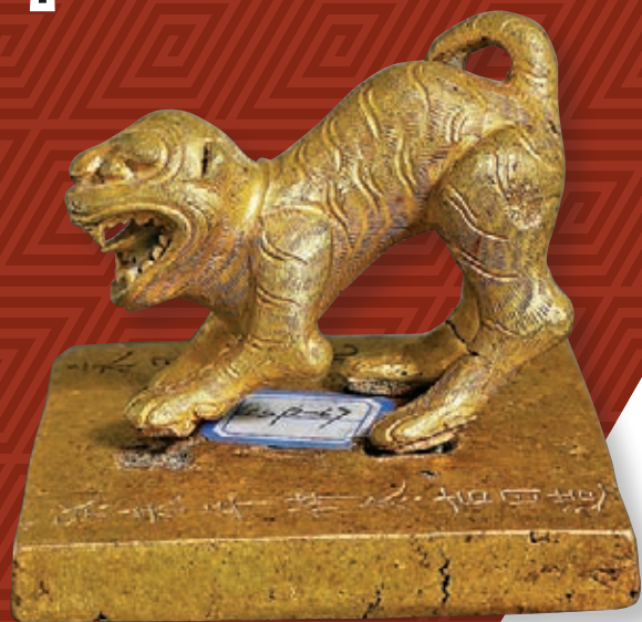
■虎鈕「永昌大元帥」金印鑄造於1643年

江口沉銀遺址位於四川省眉山市彭山區江口鎮岷江河道內，是一處保存較為完整的古戰場遺址。自20世紀20年代起，遺址所在的岷江河道內陸續發現有文物出水，2013年以來江口沉銀遺址遭到嚴重盜掘。經四川省文物局向國家文物局請示，江口沉銀遺址水下考古發掘於2016年6月獲批。