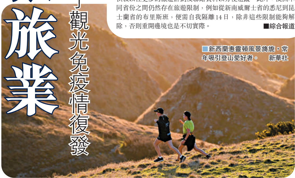
新西蘭惠靈頓風景旖旎，常年吸引登山愛好者。