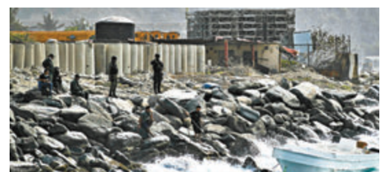
委內瑞拉指軍方在一處岸邊擊斃8名哥倫比亞傭兵。

委內雷雷羅表示，一群來自哥倫比亞的傭兵在前日清晨，於北部沿海城市拉瓜伊拉對出海域駕駛快艇嘗試登岸，當地距離首都加拉加斯約1小時車程。雷羅羅指他們企圖在委國進行「恐怖行動」，包括刺殺政府領袖，軍方及警方特種部隊成功攔截，當場擊斃8人，兩人被扣押，正循海陸空三路