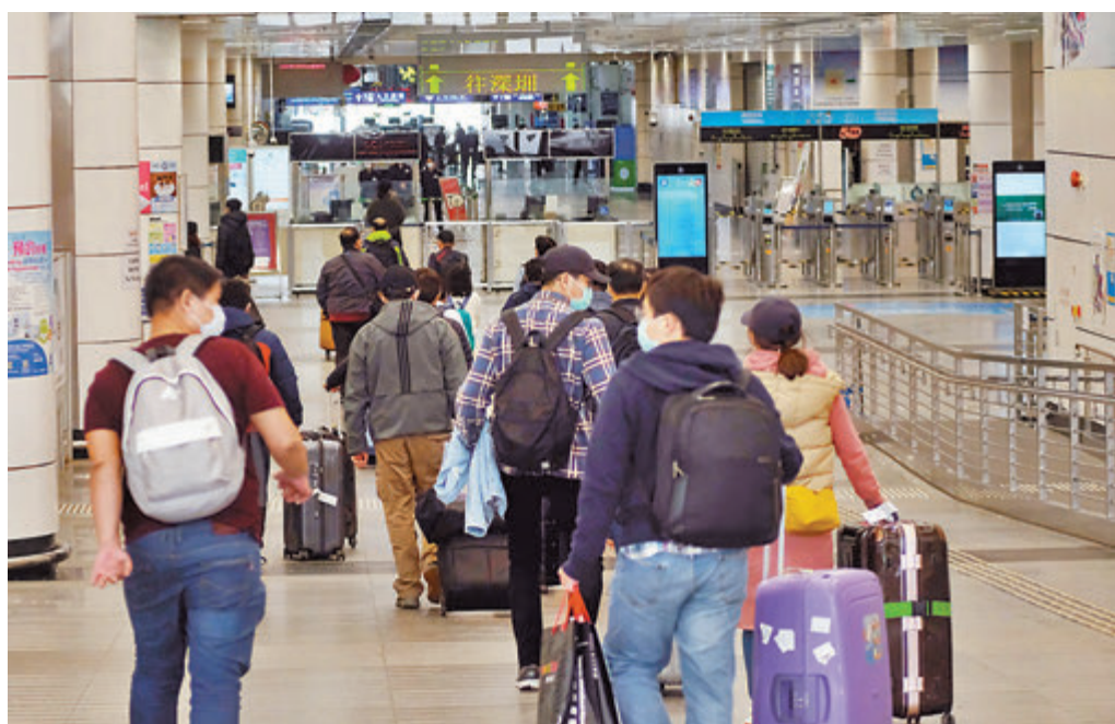
政府昨日公佈，在內地從事生產作業的香港企業，豁免接受強制檢疫的申請機制，每間企業最多兩個豁免名額，工業貿易署昨日起處理有關申請。圖為深圳灣口岸往深圳過關人潮。

早前修訂的《若干到港人士強制檢疫規例》(第五百九十九C章)，加入第四(1)(b)條，即政務司司長如信納某人或某類別人士的行程，對關乎符合香港經濟發展利益的生產作業的目的屬必要，可豁免該人或該類別人士接受強制檢疫。政務司司長昨日根據法例，即日起豁免相關類別的人接受強制檢疫，包括持有《商業登記條例》(第三百一十章)下發出的有效商業登記證，並在內地從事生產的香港企業擁有人及所僱用和授權的最多一名人員；又或企業所僱用和授權的最多兩名人員，換言之每間公司最多兩個豁免名額。