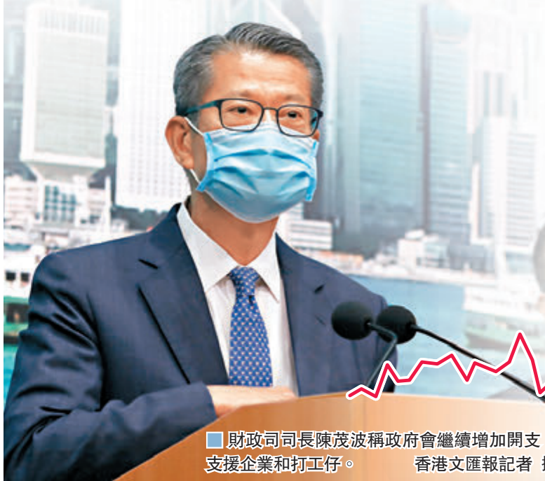
財政司司長陳茂波稱政府會繼續增加開支，支援企業和打工仔。

財爺日前大幅下降今年本地經濟增長預測，由預算案時提到的收縮1.5%至增長0.5%區間，下調至收縮4%至7%。