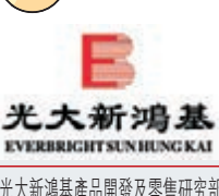
光大新鴻基 EVERBRIGHT SUN HUNG KAI