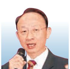
黎偉成 資深財經評論員