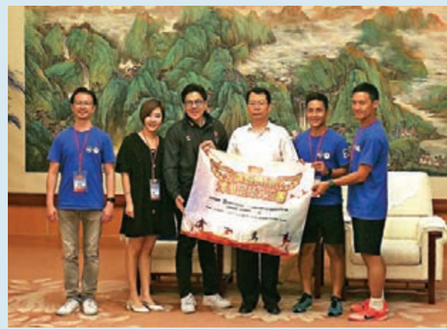
■霍啟剛(左三)帶領香港青年到天津交流。

此外，霍啟剛亦希望體院可以更多向外地運動員開放：「香港運動員若要提升水平，應該多點和國內外的運動員作交流，體院的設施屬世界級，應該讓更多全世界運動員來訓練。」