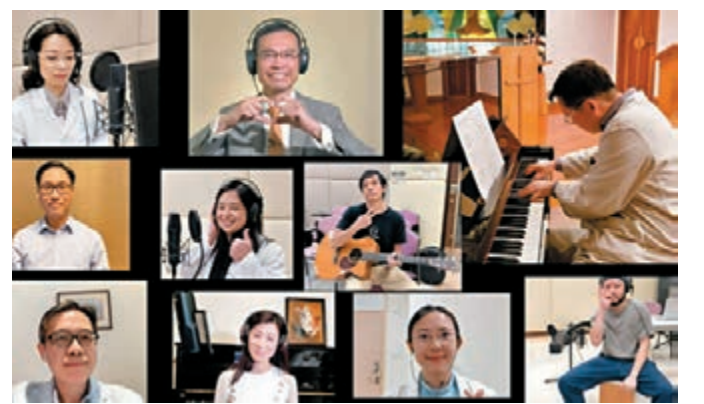
一班醫護也合作演出。

由於直播音樂會受「限聚令」限制，大會希望減低觀眾風險，特別安排部分歌手分段錄影，希望透過音樂會為居家抗疫的市民提供娛樂，並同時為醫護打氣。