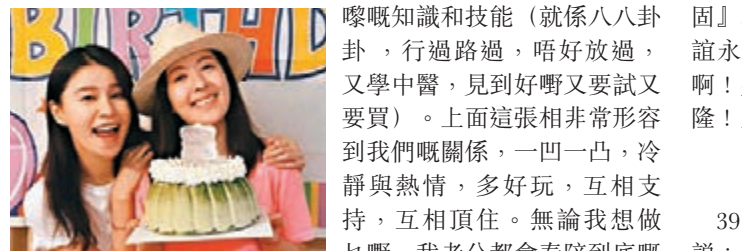
唐詩詠獲好友黃翠如率先送蛋糕慶祝。