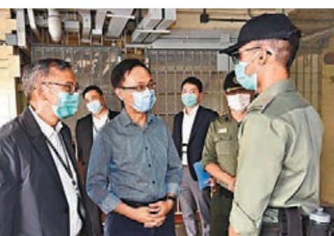
聶德權日前先後到懲教署荔枝角收押所、尖沙咀消防局和深水埗營盤街垃圾收集站,為前線同事打氣。

消防處近年聘請了非華裔消防員,在他日前參觀消防局時,就由一位入職數年的非華裔消防員向其介紹各種特別用途車輛的設備,他既「熟書」,中文