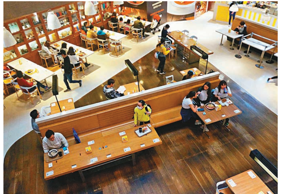
隨着疫情漸見緩和,食肆每枱客人不多於4人的規定有望獲放寬。

他形容,以往母親節正日整個飲食業可以有3.5億元至4億元的生意額,但估計今年「有兩億都已經好開心」,並希望政府在周日母親節前放寬規管餐飲業的防疫措施,由每枱最多坐4人放寬至6