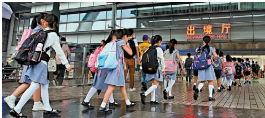
政府早前延長內地入境者強制檢疫安排,但跨境學童及商務旅客等可獲豁免強制檢疫14天。陳肇始表示,具體細節仍有待討論。

香港文匯報訊(記者 文森)政府早前延長內地入境者強制檢疫安排至6月7日,但跨境學童及商務旅客等可獲豁免