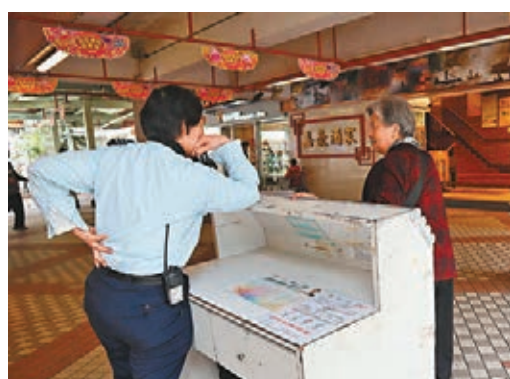
「物業管理業界抗疫支援計劃」暫批出約2,850宗申請,約25,500位前線受惠。資料圖片

香港文匯報訊(記者 文森)「防疫抗疫基金」下的「物業管理業界抗疫支援計劃」繼續接受申請,特區政府表示,截至昨日,負責執行「物管支援計劃」的物業管理業管理局已收到超過8,160宗申請,其中約2,850宗申請已獲批核,暫已批核的申請涉及超過1億元資助金額,惠及逾17,500幢樓宇及約25,500位前線物業管理員工。