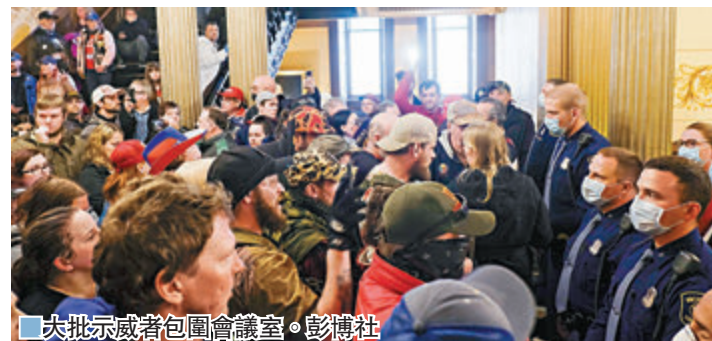
大批示威者包圍會議室。

報道指，華府官員強調有關「懲罰」中國的討論尚處於初步階段，還未認真開始將想法變成現實。也有部分官員警告特朗普不該「懲罰」中國，原因是中國正運送物資到美國，協助美方防疫工作。報道引述其中一名參與規劃「懲罰」方案的官員表示，現在並非對中國追責的合適時間，「未來會有做這件事的時候」。 ■綜合報導