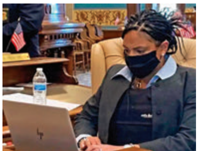
州議員穿防彈衣工作。