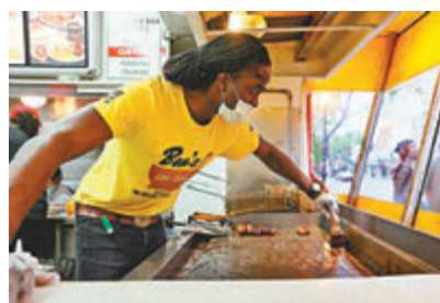
俄勒岡州食肆或需登記食客身份。