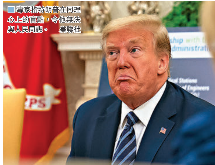
專家指特朗普在同理心的盲點，令他無法與人民同悲。