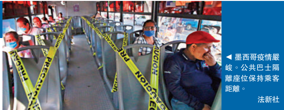
▲墨西哥疫情嚴峻。公共巴士隔離座位保持乘客距離。

負責墨西哥抗疫工作的副衛生部長拉米雷斯表示，位於美國邊境附近的工廠屬病毒傳播源頭之一，強調若工廠繼續開放，便可能觸犯公共衛生相關罪行，墨西哥部分地區已有警員到工廠區，票控違規開門的工廠。外長埃布拉爾強調，墨西哥將自行制訂工廠復工時間表。 ■綜合報道