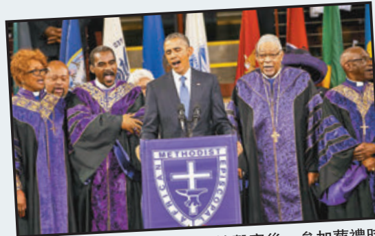
▲奧巴馬曾在2015年教堂槍擊案後，參加葬禮時領唱《奇異恩典》。