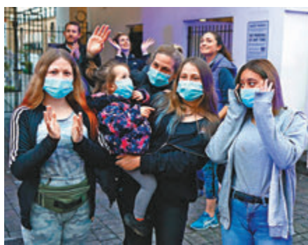
▲倫敦市民戴罩為醫護打氣。

英國目前是全歐洲疫情死亡人數第二多的國家，《衛報》分析最新公佈的護老院數據，發現其實早在3月5日當地出現首宗死亡個案前，已有最少5名護老院院友死於新