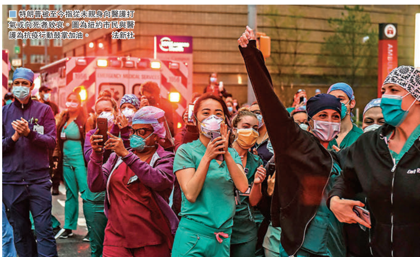
特朗普被至今指從未親身向醫護打氣或向死者致哀。圖為紐約市民與醫護為抗疫行動鼓掌加油。

白宮發言人迪里曾回應相關意見，指特朗普傾向向聚焦好事，向外界傳遞安慰、團結、力量等訊息，並採取果斷行動。 ■綜合報道