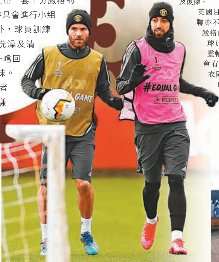
紅魔戰將到場練習，或需要以小組方式進行，以限制人數。

未有受到法甲腰斬的影響，英超復賽似乎是勢在必行。對於力爭來屆歐聯資格的曼聯而言，復賽前能否催谷球員狀態至關重要，這支目前聯賽榜排第5的豪門，計劃將於5月18日復操備戰，並已要求隊員於5月4日前返回英國，然後隔離14天趕及復操。