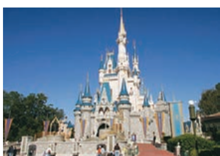
美國迪士尼樂園據報是NBA復賽場地的其中一個選址。

美國體育新聞網站 Stadium 昨天報道，如果2019-20球季重新開打，美國職籃（NBA）考慮選擇位於奧蘭多的迪士尼世界度假區為比賽地點，且已獲迪士尼同意。除了迪士尼樂園，另外拉斯維加斯與巴哈馬盛傳都是可能舉辦比賽的地點。猶他爵士中鋒高拔3月11日驗出對新冠病毒呈陽性反應後，NBA隨即暫停比賽，是否會重新開打目前還不清楚，NBA在27日宣佈了近期將會改變規定，只要設施所在城市允許，球隊將可開放練習設施，讓球員接受治療與健身訓練。不建議各隊在5月8日公佈新規定前復訓。 ■中央社