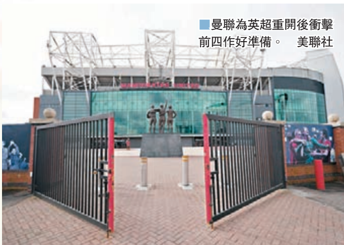
曼聯為英超重開後衝擊前四作好準備。

另外，英超賽會為協助提升球隊狀態準備比賽重啟，有意安排一些鄰近的組別球會與英超球隊進行「復賽前」熱身賽，希望球員盡快找回實戰感覺，減低受傷機會，同時也可作為賽季重開的緩排。