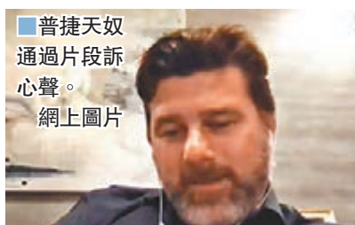
普捷天奴通過片段訴心聲。

至於熱刺前一任教頭兼被視為帶領球隊躋身強隊之列的奠基者，去年因績差被炒的普捷天奴堅信，自己總有一天會回到熱刺，「嘗試完成我們未完的偉業，之前那段旅程距離冠軍是如此之近。」