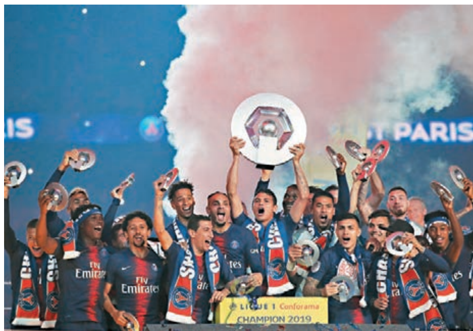
PSG有望獲頒最近8屆法甲的第7座冠軍盃盃。

腰斬球季也會造成龐大的金錢損失，法甲球會會有超過四成收入來自轉播費，如果兩家轉播商均拒絕支付本賽季剩餘的轉播費，據《隊報》稱聯賽收入將減少超過2億歐元（約18億港元），令大部分中小球隊處於生死邊緣。此外從下賽季起，擁有中資背景的西班牙傳媒公司Mediapro將成為法甲最大轉播商，法甲每年轉播收入將首次逾10億歐元，根據合約今年8月先會到賬1.3億歐元，故此法甲也不願太遲展開新球季。 ■綜合外電