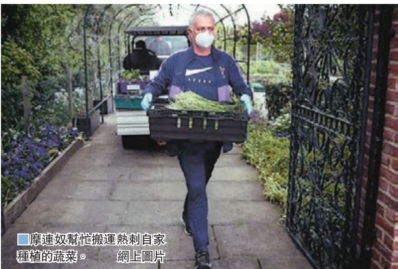
摩連奴幫忙搬運熱刺自家種植的蔬菜。網上圖片