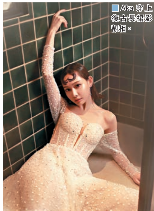
Aka 穿上復古長裙攝影。

黎耀祥選擇留家抗疫,這段日子會親自落廚炮製美食,早前便分享自家製的「黎家星洲炒米」,手勢純熟,有板有眼,他說:「留在家中響應抗疫,不忘生活趣味,自家製的其中一款美食。」昨日趁着節日,喜歡食蟹的黎氏夫婦便在家品嚐巨蟹,黎耀祥在社交平台放上片段,當中是他拿了一隻超級巨型的蟹放上鑊裡蒸,並寫上「抗疫良方 心情開朗」,果然是療癒好心情的炒法!