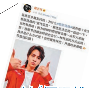
醜聞爆出前,羅志祥還表示有份拍《極限挑戰》。