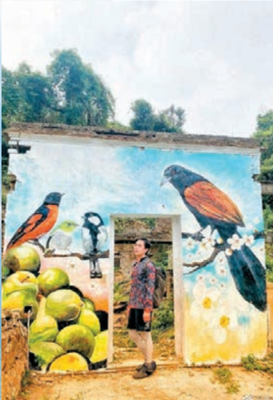
近期甚少公開露面的 Bosco 頭髮長了。

之後嘉玲再分享單人照和發哥合照,當然是由擅長自拍的發哥操作相機,嘉玲在鏡頭前又腰高舉拇指手勢,活力十足,相中所見還有幾位友人同行,嘉玲和發哥笑容燦爛,完全表達出悠閒自在的一面,嘉玲留言:「任四季變幻,在節氣裡感受歲月靜好」、「Peace is always beautiful」。