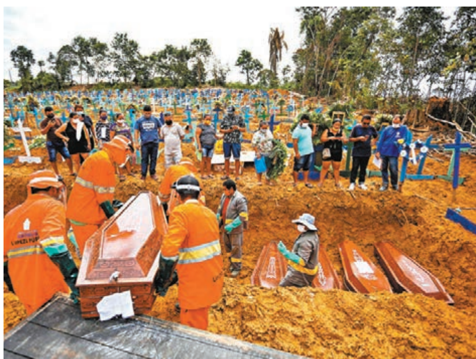
巴西城市馬瑙斯因死者眾多，只能在墓地一個坑穴內擠進5具棺材，「棺材疊棺材」情況也曾出現。

巴西的新冠肺炎疫情是拉美國家中最嚴峻，當地亞馬遜流域的大城市馬瑙斯更因死者眾多，只能在墓地一個坑穴內擠進5具棺材，甚至發生「棺材疊棺材」情況。對於死亡人數急升，曾淡化疫情的巴西總統博爾索納羅表示自己無法創造奇蹟，稱「這又如何？我對不起好了，但你想我怎樣做？」其言論備受外界抨擊。