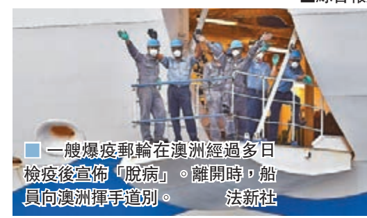
一艘爆疫郵輪在澳洲經過多日檢疫後宣佈「脫病」。離開時，船員向澳洲揮手道別。