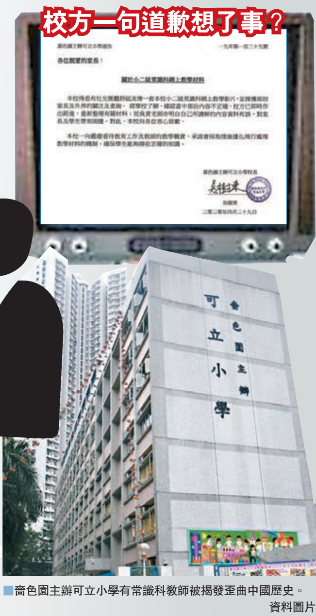
齋色園主辦可立小學有常識科教師被揭發歪曲中國歷史。資料圖片