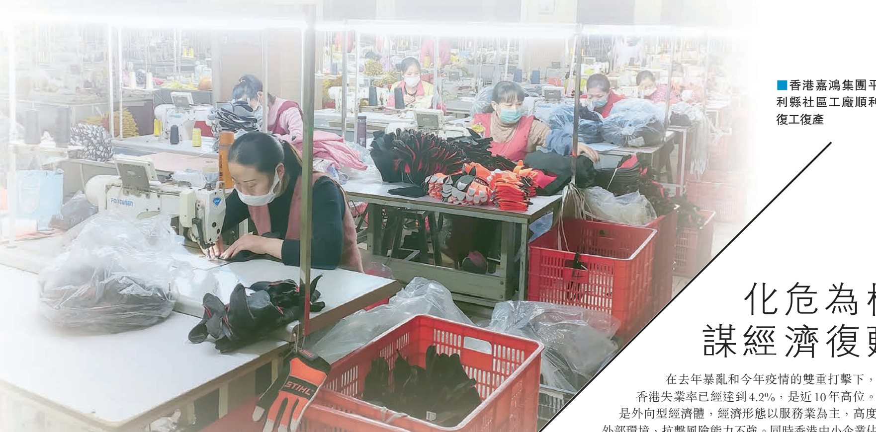
香港嘉鴻集團平利縣社區工廠順利復工復產