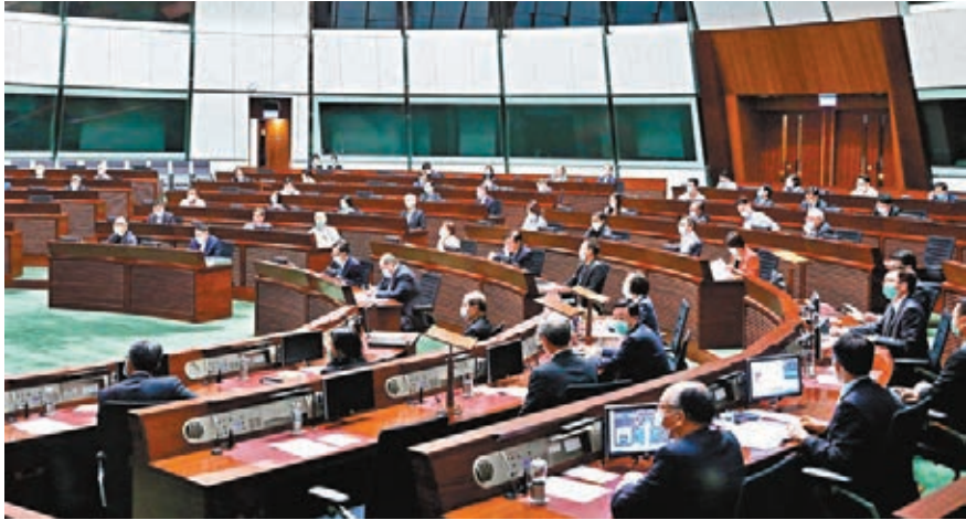
■立法會昨日二讀通過《撥款條例草案》，進入全體委員會階段，反對派重施故伎，不停拉布。