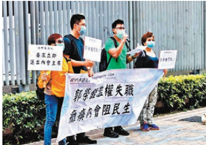
■團體「政中香港人」代表參與請願，希望全體立法會內會議員能撥亂反正，履行責任，向市民交代。

香港文匯報訊（記者 子京）公民黨立法會議員郭榮鏗濫用主持職權，與反對派議員「互扯貓尾」，令內會陷入停擺，嚴重影響立法會正常運作。再有多個民間團體及市民昨日到政府總部請願，要求立法會主席梁君彥盡快入稟法院，以郭榮鏗未有盡忠職責、違反宣誓誓言為由，撤銷其議員資格，讓議會進程回歸正軌。