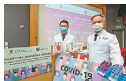
■中大公佈招募3,000港人測試，參與新冠病毒隱性感染研究。中大圖片留下唾液樣本。黃至生指出，參加者將在6周至8周收到檢測結果，參加者若呈IgG陽性，主辦者會再邀請其緊密接觸者參加第二輪研究等。

醫學院會隨機抽出參加者，他們只到沙田滙源健康院、家庭醫學診所提供血液及唾液樣本；兒童則只需要