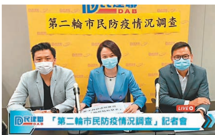
■民建聯公佈「第二輪市民防疫情況調查」。

醫學院會隨機抽出參加者，他們只到沙田滙源健康院、家庭醫學診所提供血液及唾液樣本；兒童則只需要