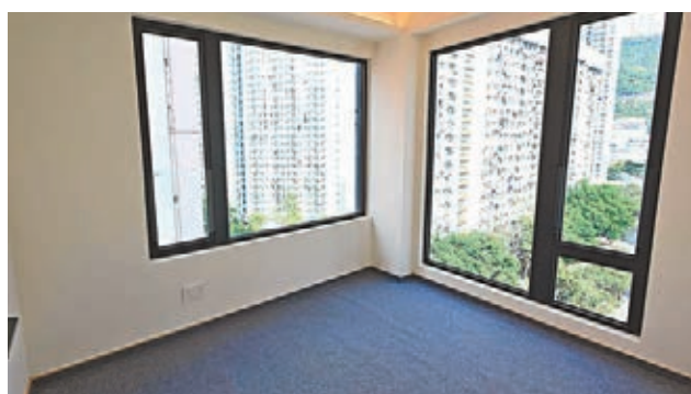
圖為葵芳匯11樓B室示範單位，間隔四正。

香港文匯報訊（記者 梁悅琴）疫情下令本地地價持續出現低價成交，上周五截標時接獲27份標書的旺角豉油街與上海街交界的蚊型用地，最終以4.67億元批予Worth Forever Limited，以最高可建樓面地皮約6.06萬方呎計，每呎樓面地價約7,700元，貼近市場估值下限。綜合市場估價介乎4.2億至6.4億元，每平方呎樓面地價為7,000至1.05萬元。上周五截標時接獲27份標書，包括長實、佳兆業集團、越秀、晶苑地產、佳明、大昌地產、永泰、遠展、爪哇、英皇、建源地產等。