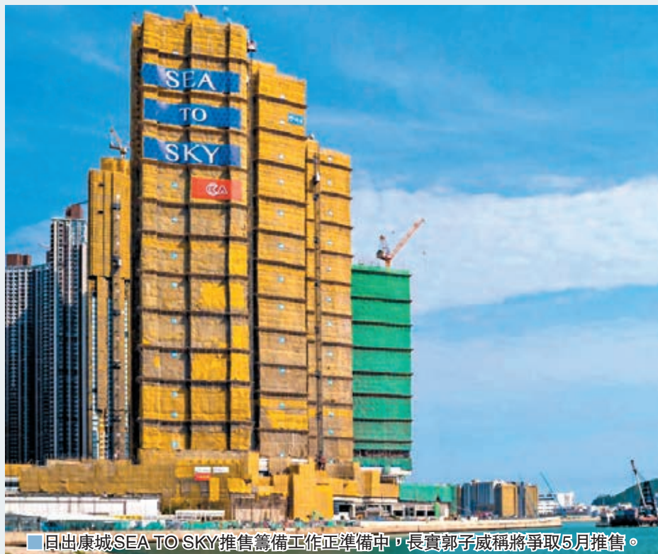
日出康城SEA TO SKY推售籌備工作正準備中，長實郭子威稱將爭取5月推售。

華懋集團旗下清水灣碧沙路18號瑛廬以9,542.09萬元售出6號屋，獨立屋樓高三層連天台，設4房（3套房）間隔，實用面積為3,284方呎。