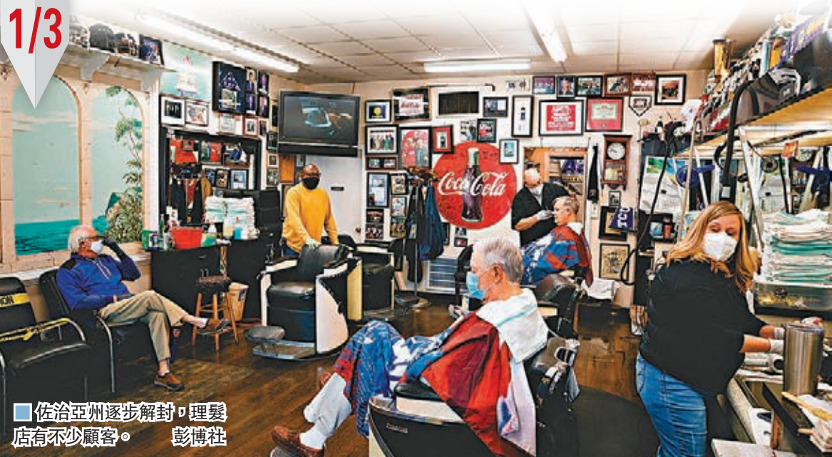
■ 佐治亞州逐步解封，理髮店有不少顧客。

民眾外出時，雖然理論上可以繼續保持2米社交距離，並戴上口罩、手套等，不過張磊引述近期新聞報道，提到海灘等地開始有人群聚集，證明根本難以保持社交距離。 ■ 綜合報導