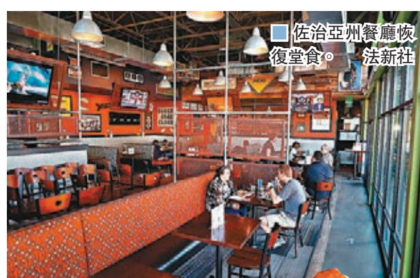
■ 佐治亞州餐廳恢復堂食。 法新社 ■ 店員捧餐時戴着塑膠手套。 法新社