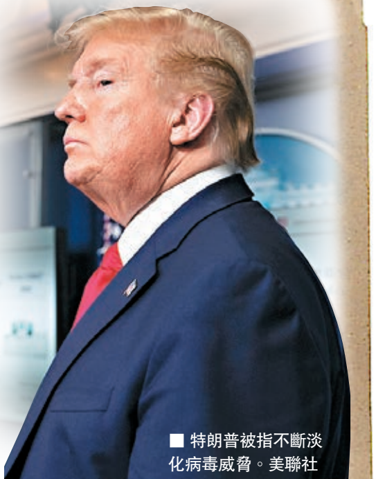
■ 特朗普被指不斷淡化病毒威脅。

特朗普在上周疫情簡報會的「注射消毒劑殺毒」謬論，惹來各界批評，結果周末期間白宮未有再舉行簡報會。到了周一，白宮亦一度公佈取消簡報會，卻在短短數小時後又宣佈召開，內容主要圍繞增加病毒檢測能力，白宮發言人亦透露，未來簡報會將聚焦重啓經濟活動。 ■ 綜合報導