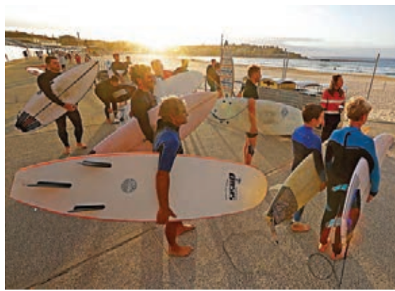
眾衝浪愛好者進入邦迪海灘。