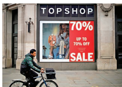
倫敦一家商舖打折銷售。

廚具、餐具等家居用品，目前則以戶外活動相關產品最受歡迎。有韓國零售業人士形容，消費者的心理正逐漸恢復，隨着教會聚會等活動重新展開，預料女裝及化妝品銷售額未來一兩個月也會反彈。