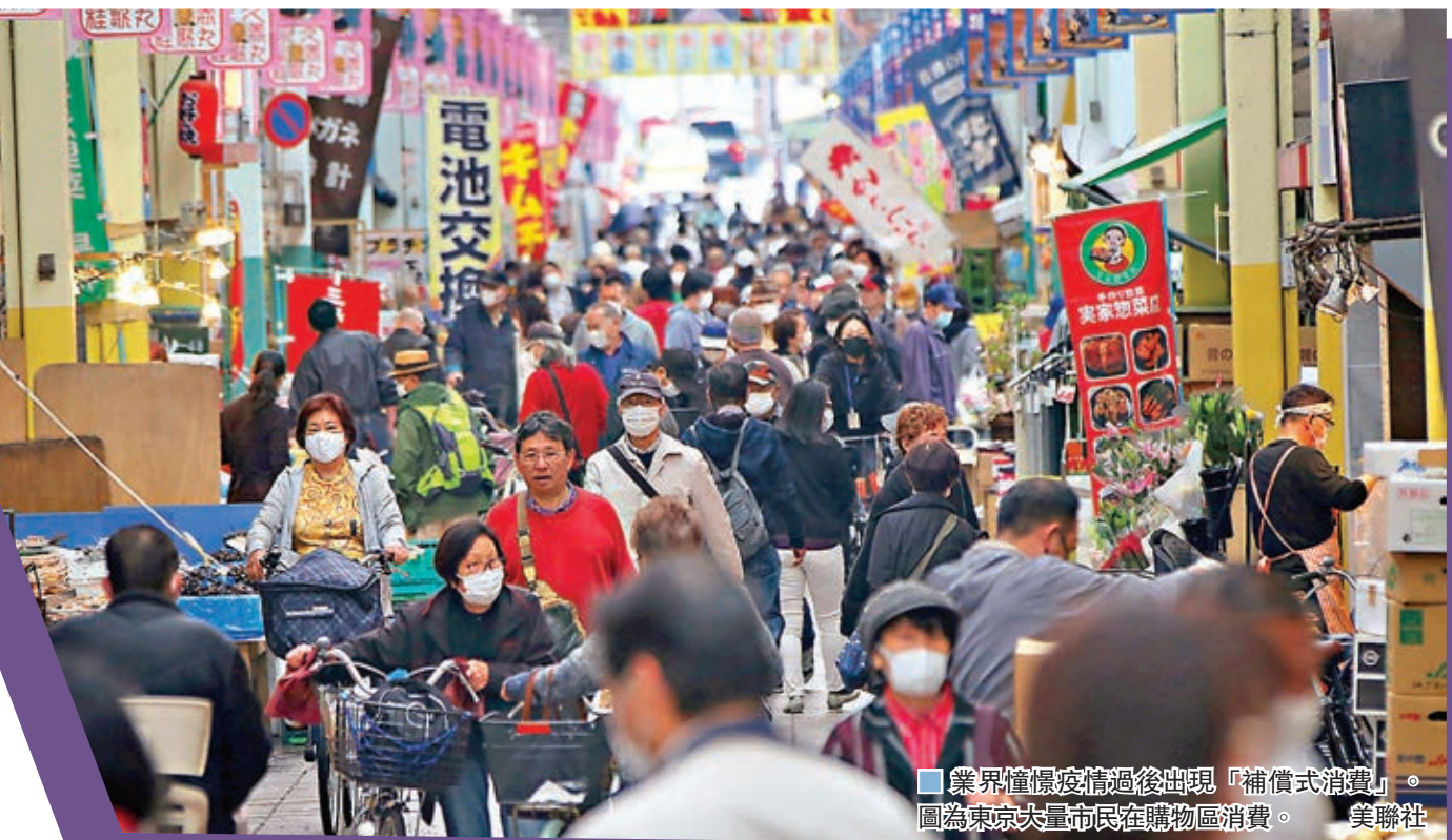
業界憧憬疫情過後出現「補償式消費」。圖為東京大量市民在購物區消費。

韓國的疫情近期有所緩和，國民消費意慾有跡象復甦，其中樂天百貨、現代百貨3月銷售額按年大跌超過30%，4月按年跌幅已減至5.8%，戶外及體育用品銷量更上升。首爾市郊多間百貨公司特賣場甚至成為消費熱點，其中NC百貨上週在江西區分店舉行的周年特賣活動吸引多人排隊，單日營業額達85億韓圓(約5,377萬港元)。