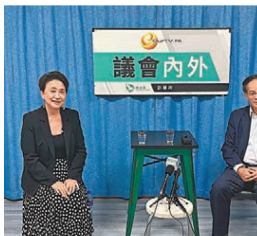
葉國謙(右)指出，真正破壞香港法治和自由的是煽暴派及暴徒。

香港文匯報訊(記者 兩航)反對派過去7個月惡意拉布，導致立法會內務委員會至今仍未選出正副主席，多項法案被擱置。港區全國人大代表、行政會議成員葉國謙昨日接受網台訪問時表示，香港社會過往一直求同存異，尊重各種政見，惟反對派近年刻意挑起矛盾，更煽動暴徒「違法達義」，呼籲他們不要再與中央對着幹，斷送香港的民生、自由和法治。