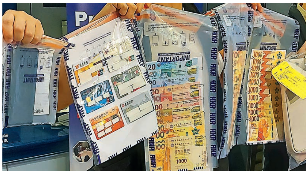
▲警方展示在偵破電話騙案中檢獲的證物。