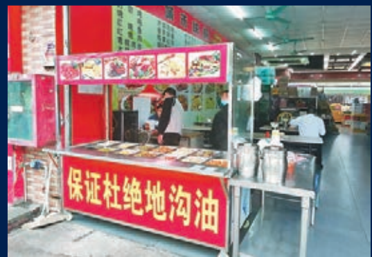
■ 重慶唐先生指，港京皮具鞋廠將影響其生意，未來將可能虧本經營。 記者 李昌鴻 攝

「因為全球疫情外單都沒有了，老闆本來準備放假三個月，其中前兩個月按正常工資支付，第三個月給生活費補助，但一些年齡大的五六十歲的員工不同意，老闆只好暫時關門歇業，並且按員工平時工資而非最低工資進行賠償。」劉先生感慨說，鄺老闆認為員工跟著他打拚了幾十年不容易，就按頂格來賠償，許多做了十多年員工因此獲得較基本工資高約40%至200%的賠償，最少的也有四五萬元，多的有二十多萬元，他從財務負責人那裡了解到，此次賠償金接近3,000萬，會在4月29至30日全部發放。