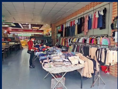
■ 陳女士指，港京皮具鞋廠歇業將令其生意更加難做，未來或只得關門。