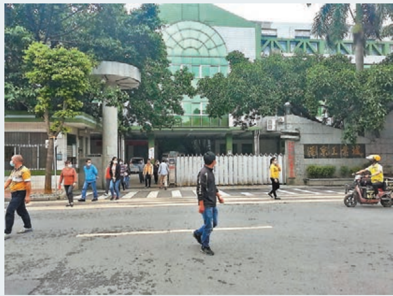
■ 港京皮具鞋廠將於4月底歇業並頂格賠償員工，總耗資約3,000萬人民幣，圖為位於松崗的港京皮具鞋廠。