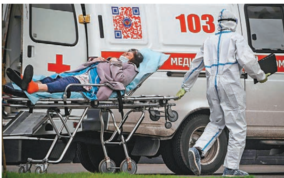
俄羅斯疫情驟然加劇增加了中國的防控壓力。