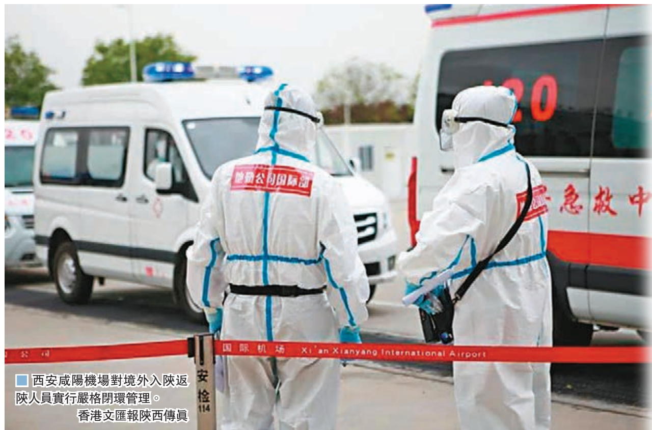
西安咸陽機場對境外入陝返陝人員實行嚴格閉環管理。

香港文匯報訊（記者 李陽波 西安報道）陝西省衛生健康委28日上午發佈消息，2020年4月27日8時至28日8時，陝西新增境外輸入新冠肺炎確診病例20例、無症狀感染者5例，均為中國籍，係4月26日乘坐莫斯科至北京CA910航班人員。據悉，此前4月19日由莫斯科至北京的CA910航班，目前已累計報告確診病例30例、無症狀感染者8例。截至28日8時，陝西已累計報告境外輸入新冠肺炎確診病例61例，其中治愈出院11例，仍住院治療50例。陝西目前已連續68天無新增本地確診病例。