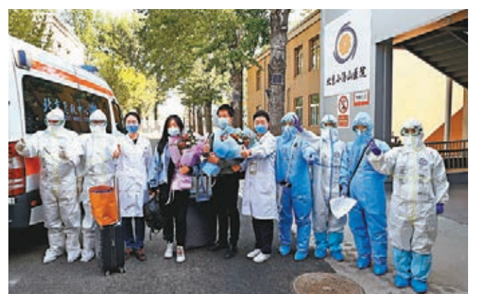
北京小湯山醫院將於29日起關閉備用。

值得一提的是，最新科技投用今成為小湯山醫院一大亮點。在小湯山醫院，人工智能普遍應用於放射檢查、檢測檢驗、藥品服務、後勤保障等多個領域，如AI輔助診斷系統10秒完成影像篩查、病例錄入語音系統、自動分藥機、人臉識別一體機、送貨和消毒機器人、智能污水處理系統等眾多信息化技術科技的及時應用，節省了人力，提高了準確性，更減少了院內交叉感染風險。