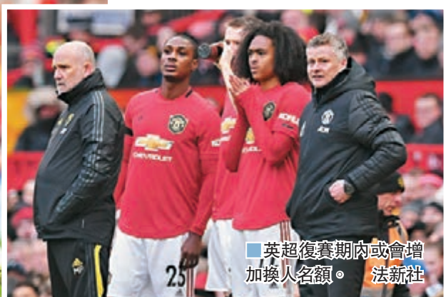
英超復賽期內或會增加換人名額。