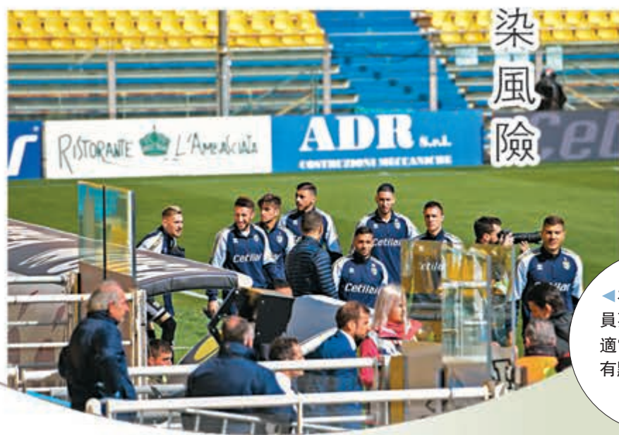
在比賽時職球員要每人都保持適當距離，難免有點不切實際。

有見及此，德國足總日前亦定下了一系列指引，務求保證球員健康，當中包括職球員賽前需住酒店或留宿；球員或伴侶若有病徵，禁止有親密行為；球隊一定要在大房間開會，禁止進食；球員賽前可自行駕車到場，其餘由不同隊巴接送至球場，抵場後需量體溫；兩隊不會同時出現在隧道內，不會有球員保安隊伍和吉祥物；後備席球員之間要有2至3個座位距離；球員需自備水樽；賽後鼓勵球員回家或酒店洗澡、更換衣服以及隊巴要在不同時間離開等。有關方面自然希望上述措施能夠使聯賽順利復賽，亦有些是針對閉門作賽的安全措施，但一切是否真的有效，仍有待時間驗證。