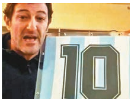
費拉拿捐出珍藏33年的馬拉當拿球衣拍賣。網上圖片

費拉拿早前和同樣出身於拿玻里的意大利名宿簡拿華路成立了一個基金會，希望協助出身地走出疫境。近日，費拉拿決定拿出和馬拉當拿於拿玻里當隊友時，「老馬」送贈他的一件阿根廷10號球衣供拍賣，最終這件據報收藏了33年的球衣，助基金會籌得5.5萬歐善款。老馬本人對費拉拿的善舉也是大為讚賞，他在Facebook留言：「謝謝你，費拉拿，你讓我再次感受到那不勒斯人的熱情。」