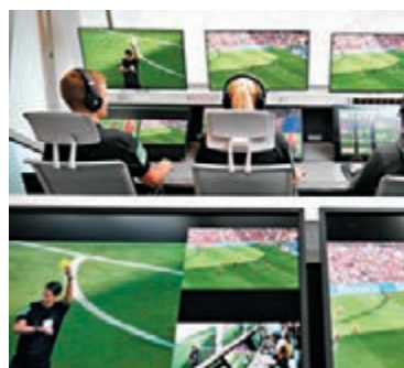
VAR監控房間內，按之前賽例會有3至4名助理球證協助執法。

VAR暫取消？ 據英國《每日郵報》報道，英超高層擔心三個視像助理裁判擠在一間封閉小屋內觀看錄像，有違英國政府的群體隔離政策。前英超球證卡頓保就表示：「如果球賽復賽仍然強調要顧及社交距離，那根本不可能使用VAR。」然而VAR的取消只會是暫時性，在疫情完結後，英超賽會仍是會恢復使用VAR。