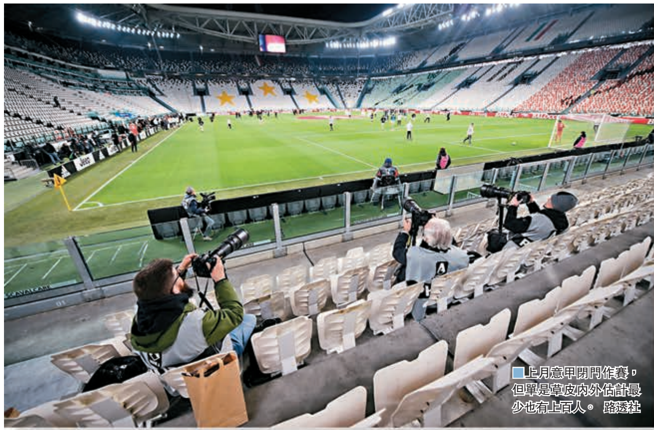
上月意甲閉門作賽，但單是草皮內外估計最少也有上百人。