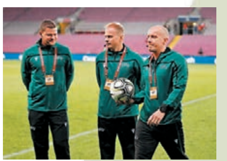
球證之間亦難以避免交流。