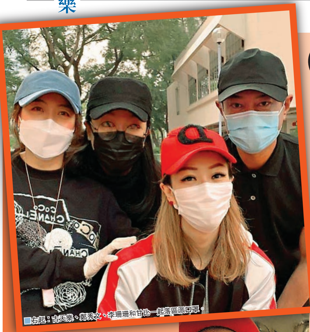
右起：古天樂、鄭秀文、李珊珊和甘比一起落區派口罩。