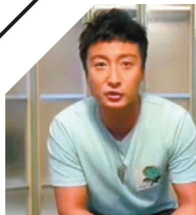
小方成功的背後付出不少努力。

向來低調的古仔並沒有把派口罩一事分享，不過他為居家抗疫注入正能量，過往一年忙足365日，現時防疫期間沒事少出門，難得留在家休息，好讓他去感受一下簡單日常的樂趣，在剛過去的周末，古仔便在家嘆咖啡和煲劇，他留言謂：「各位古迷，這個星期六過得怎樣？天氣不是太晴朗的一天，我就在家裡喝着咖啡，看了幾部新的和舊的電影，我非常喜歡這種簡單的日常生活，令我身心也得到充分的休息。」