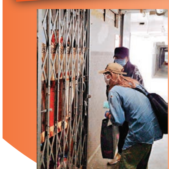
Sammi不時到屋邨上門給長者送物資。