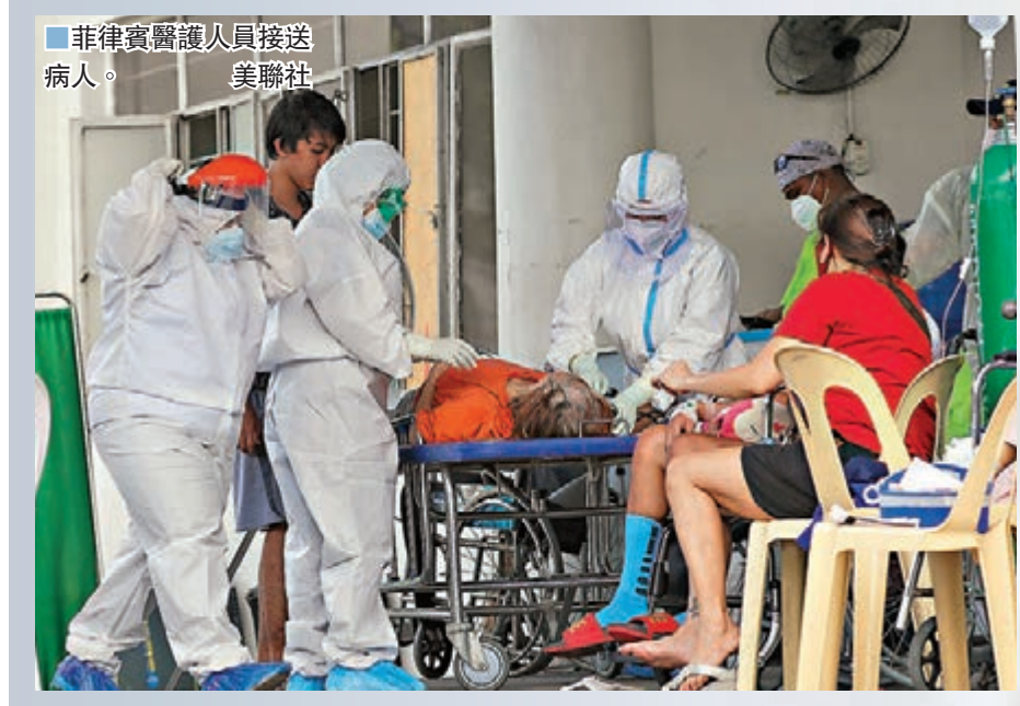
菲律賓醫護人員接送病人。