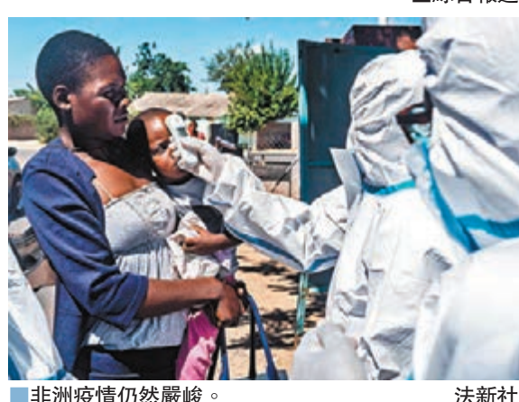
非洲疫情仍然嚴峻。