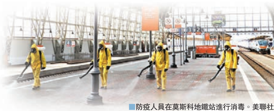
防疫人員在莫斯科地鐵站進行消毒。