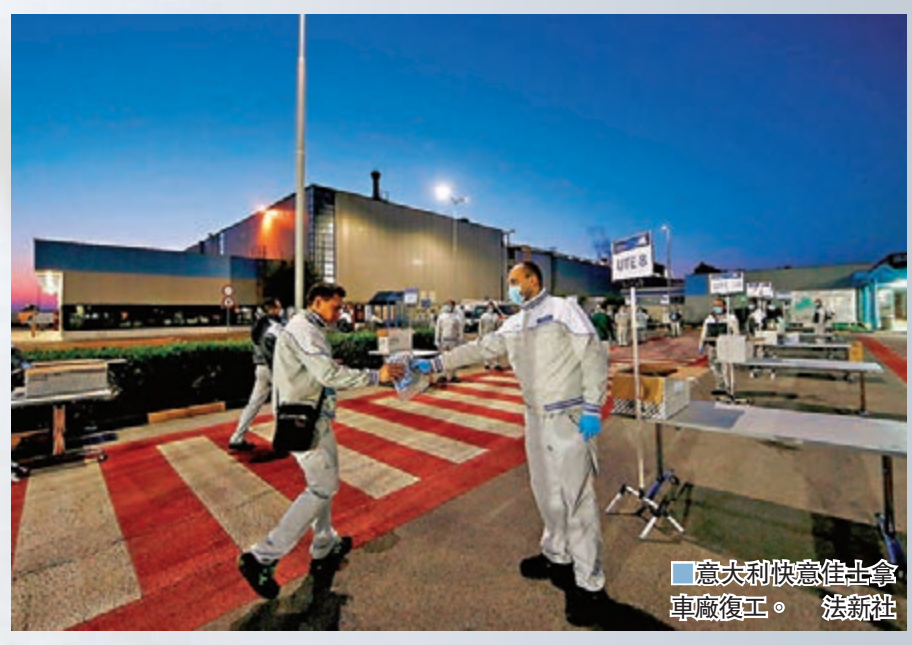
意大利快意佳士拿車廠復工。