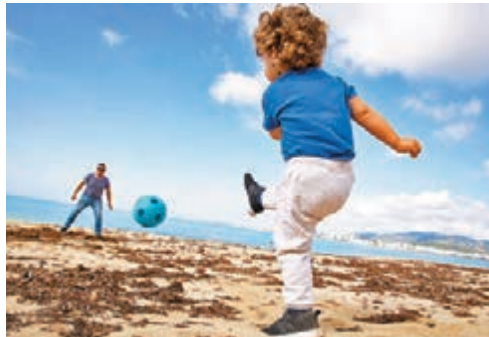
西班牙兒童獲准外出，有父子馬上到沙灘享受天倫之樂。

歐洲和亞太一些國家因此開始探討復工，其中法國今日會公佈解禁細則，意大利、西班牙亦已恢復部分商業活動，新西蘭則在昨日下調封鎖級別。然而各國對放寬措施可能造成第二波爆發不敢掉以輕心，其中德國正繼續改裝臨時醫院，為新一波疫情作準備，顯示全球疫情仍隨時可能惡化。