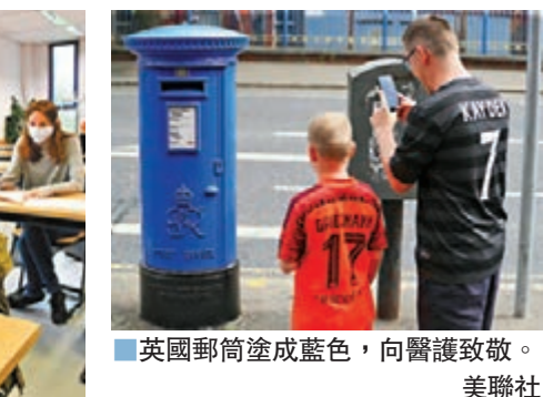
英國郵筒塗成藍色，向醫護致敬。