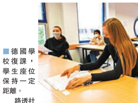
德國學校復課，學生座位保持一定距離。