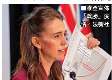
雅登宣佈「戰勝」疫情。