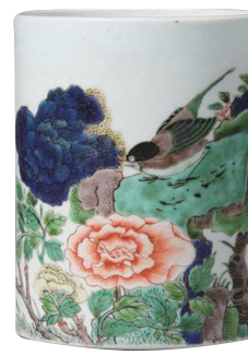
■清康熙五彩花鳥紋筆筒