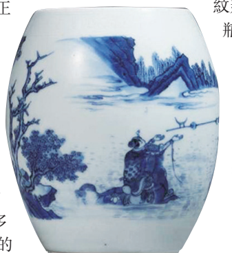
■明崇禎青花三國「馬躍檀溪」故事圖蓮子罐