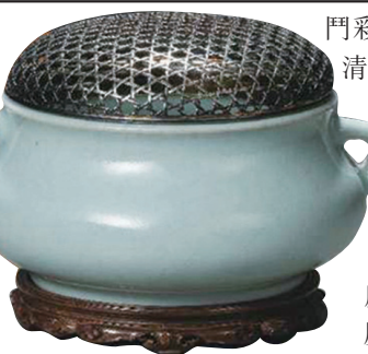
■清雍正仿官釉雙耳爐