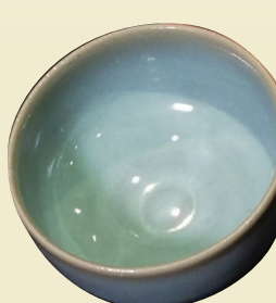
■宋代鈞窯天藍釉羅漢碗