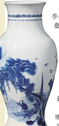
■清康熙胎繪青花漁家樂圖觀音瓶