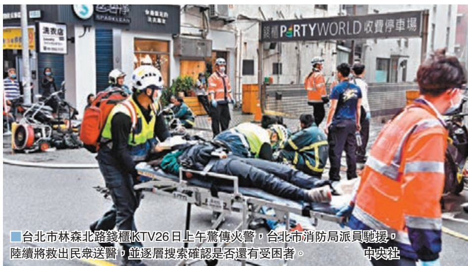
■台北市林森北路錢櫃KTV26日上午驚傳火警，台北市消防局派員馳援，陸續將救出民眾送醫，並逐層搜索確認是否還有受困者。

香港文匯報訊（記者 蔣焯基 綜合報道）台北市林森北路錢櫃KTV4月26日近11時發生火災，截至香港文匯報記者發稿已知共有54人送醫，其中5人宣告死亡，2人到院前已無呼吸正在搶救中，另有7人意識不清。傷者多為濃煙嗆傷，多為來不及逃生者。台北市消防大隊第三大隊長王正雄受訪時表示，整棟大樓消防設備被關掉，為嚴重人為疏失。專業人士告訴香港文匯報記者，從目前披露信息研判，經營業者施工不規範、消防安全意識缺失，民眾逃生意識淡薄等綜合因素疊加，或為導致是次災禍原因。該人士亦指，此前施行多年的「防火管理人制度」，不知在蔡政府執政下是否有真正執行到位。