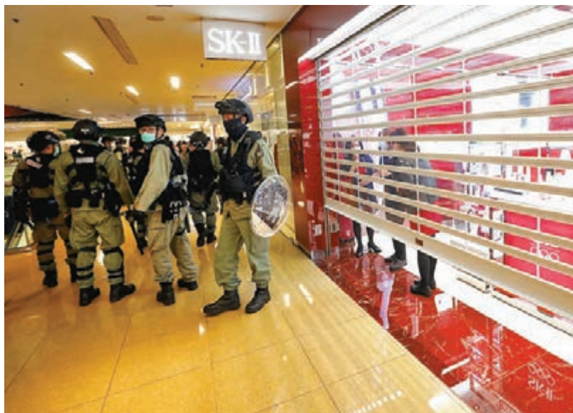
不少商舖紛紛落閘避禍。

警方表示，早已留意到網上有人煽動群眾到太古城中心一帶進行公眾活動。根據《預防及控制疾病（禁止群組聚集）規例》（第五九九G章）（俗稱「限聚令」）規定，由3月29日至5月7日，在公眾地方不得進行多於4人的群組聚集。任何出席公眾活動者，如抱有共同聚集目的，均屬於公眾地方群組聚集；而該公眾活動如有多於4人參與，所有參與者均涉嫌違反「限聚令」，不論群組聚集者是否相距1.5米，都涉嫌違規。