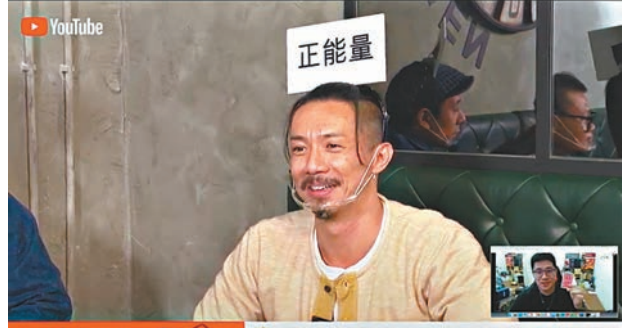
張繼聰繼續發揮搞笑本色。