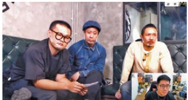
「輕勾」成員一起訪問加葱。 網上圖片