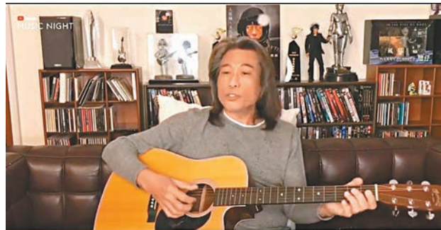
夏韶聲鼓勵大家耍其歌曲《永不放棄》一樣。