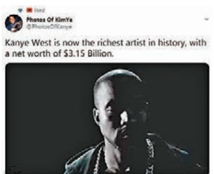
Kanye West 自稱是史上最富有的藝術家。

Kim Kardashian 嫁給 Kanye West 的時候，他已經破產，身無分文，可是有無數好的想法。他曾經寫信給 Facebook 創辦人朱克伯格 (Mark Zuckerberg)，希望他投資給自己的創意。朱克伯格根本就沒有理會他。經過他多年的打拚，Kanye